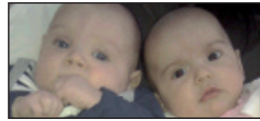
• Zorionak, Nakor eta Naia! Hiru hilabete bete dituzue! Familiakoan partez.