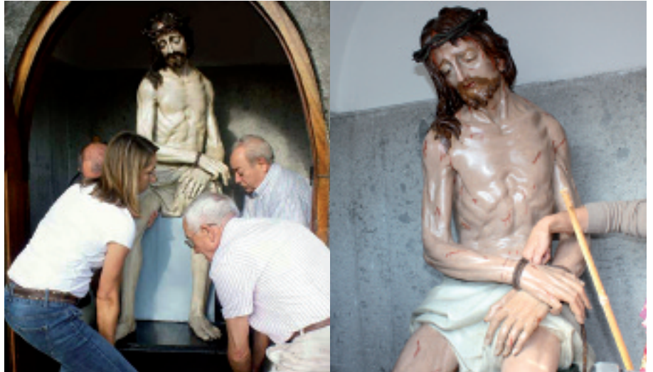
Ezkerrean, zaharberritzera eraman zuteneko argazkia eta eskuman gaur egungoa.