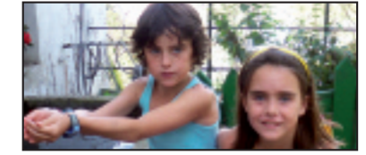
• Zuen egunak datoz! Aupa neskak! Ondo ondo pasa eta zorionak! 10 eta 11 urte dira potoloak, zorientzen zaituztegu, etxeko guztiak.