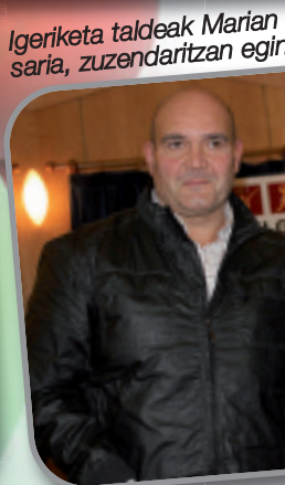
Igeriketa taldeak Marian saria, zuzendaritzan egindako lanagatik.