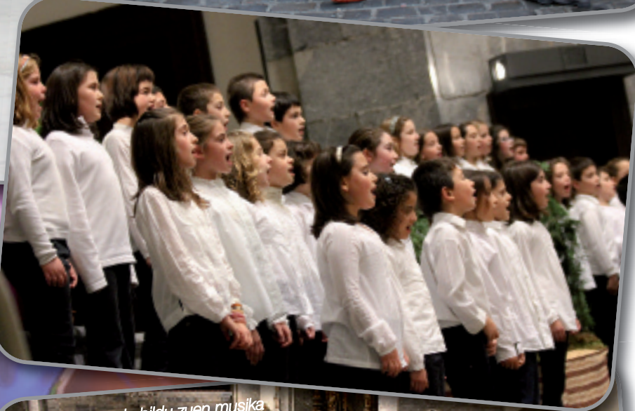
Eliza bete jende bildu zuen musika eskolaren kontzertuak.