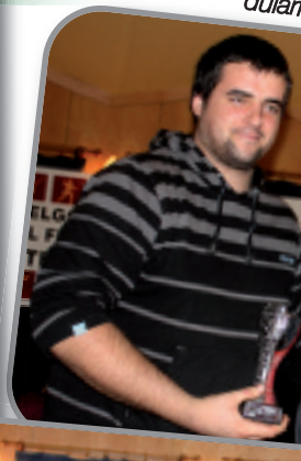
Angel Mar zion saria La dular...