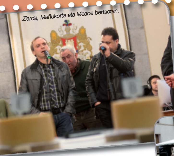
Ziarda, Mafukorta eta Meabe bertsotan.