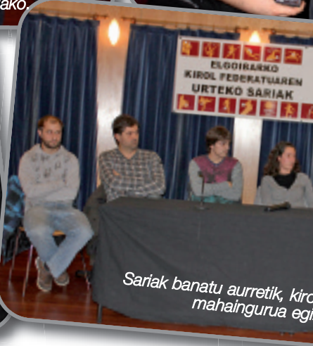
Sariak banatu aurretik, Kirol mahaingurua egiten...