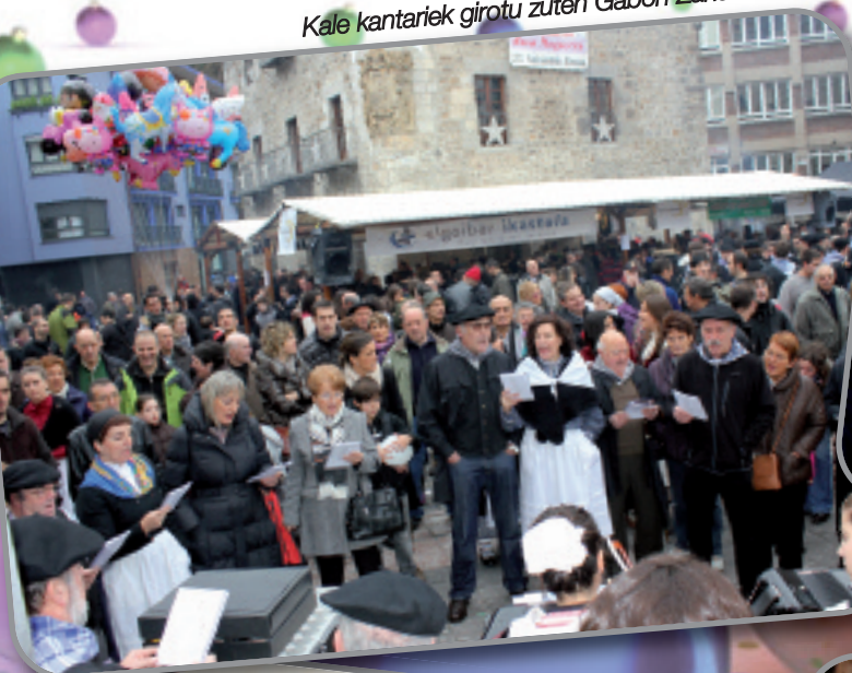
Kale kantariak girotu zuten Gabon Zahar feria.