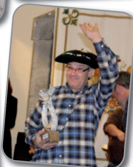
Txillarre baserriak jaso zuen barazki postu onenaren saria.