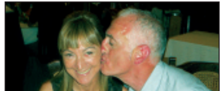
• Zorionak bikote, zuen zilarrezko ezteingatik. Guk ere gustura ospatuko dugu. Etxekoen partez.