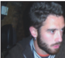
• Zorionak, Zuhaitz eta Sare zuen urtebetetzeagatik. Muxu bana.