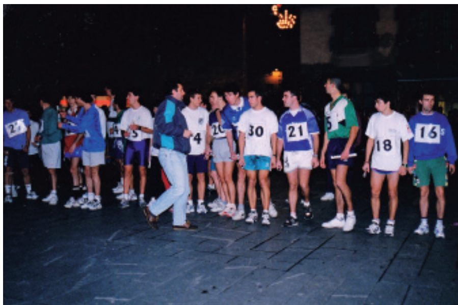
Korrika erreleboen hasieran ateratako argazkia, 1998an.

zuten partehartzeak. 1999. urtean bederatzi talde bakarrik lehiatu ziren Gabonetako torneoan, eta 2000. urteko edizioan bost talde besterik aurkeztu ez zirenez, bertan behera lagatzea erabaki zuten antolatzaileek.