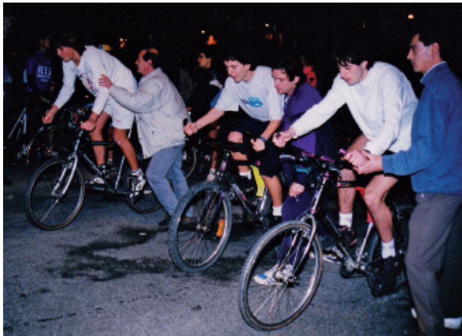
1998an, txirrindularitza proba hasteko prest.

Koadrilen arteko Gabonetako torneooa 1999an egin zen azkenekoz. 1991n sortu zuten, eta hasierako urteetan sekulako arrakasta izan zuen: estreinako aldian hamasei taldek hartu zuten parte. Orduan, sei kiroletan lehiatzen ziren parte hartzaileak: igeriketa, tenisa, areto futbola, saskibaloia, pala eta krosa. Hirugarren edizioan, ordea, tenisa eta igeriketa kendu eta bizikletan Erretxindiraino egin beharreko taldekako erlojuz kontrakoa sartu zuten. Gabonak eta kirola uztartzea lortu zuen torneoak, eta urterik one-