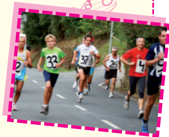
San Antolin jaiak 2009