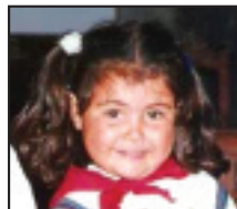
• Koadrilako txikixenak ere bete ditte urtiak! Zorionak eta muxu bat zuretza-ko.