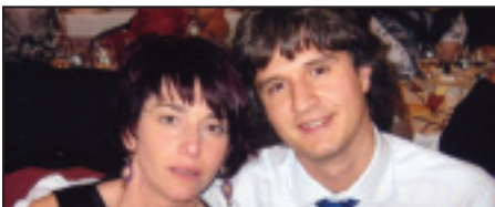
• Guk zuen ezkontzan bezain ondo izan zaitezte. Zuen lagunak.