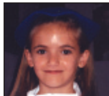
• Zorionak zure zortzigarrenean. Patxo handi bat denon partez.