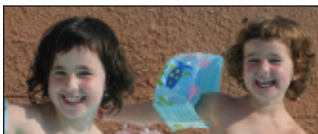
• Zorionak etxeko printzesei, zuen urtebetetzean. Mila ki- lo muxu familiakoan eta Sararen partez. Paaaaaaa!