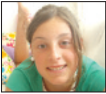
• Zorionak, etxeko bi printzesei! Muxu potolo bana eta ondo pasa!