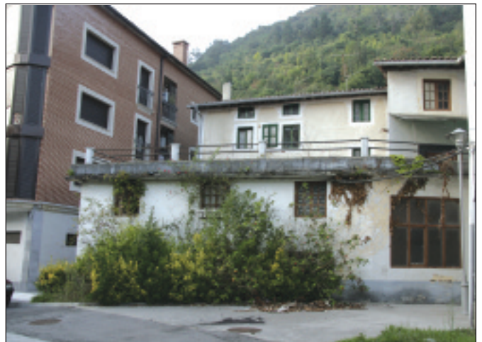
Garagartzako Abadetxea ezkerrean, eta Potxerokua eskuinean. Termitak hartu dituzte biak.