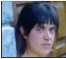
• Zorionak, ama-semeei , 30 eta 2 urte egin dituzuelako. Ondo pasa!