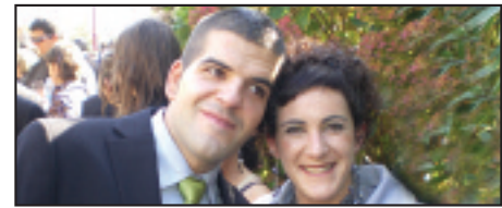
• Zorionak, bikotet! Iritsi da egun handia! Zapatuan dena emateko prest azalduko gara.