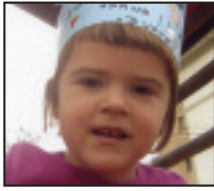
• Zorionak, Udane , joan zen astean 3 urte egin zenituelako. Muxu bat familiakoen eta Goiatzen partez.