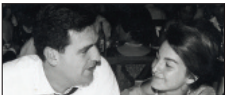
• Zorionak urezko ezteiak horren osasuntsu ospatuko dituzuelako. Eguna ederra pasa.