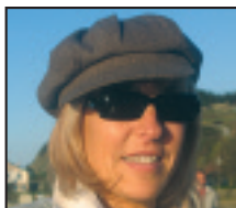
• Zorionak, marxosa , 25ean pilote urte egin dituzelako! Familiaren partez.