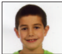
• Zorionak, Perul Atzo 9 urte bete zenituelako. Muxu asko etxekoan partez.