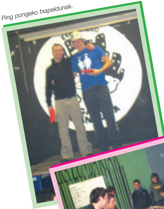
Ping pongeko txapeldunak.

Gaztetxean ping pong eta futbolin txapelketa jokatu zuten orain dela aste bi eta hona hemen argazkiak. Bestalde, abenduaren 13an gaztetxe eguna izango da, honako egitarauarekin: bertso-trikipoteoa, jolasak, kantababajana (txartelak 5 euroan, Txuri-Beltz, Lanbroa, Iratxo eta Toletxen) eta kontzertuak (The Last, Strength, Kruders, Red District eta Strikers). Indarberrituta dator gaztetxea!!!