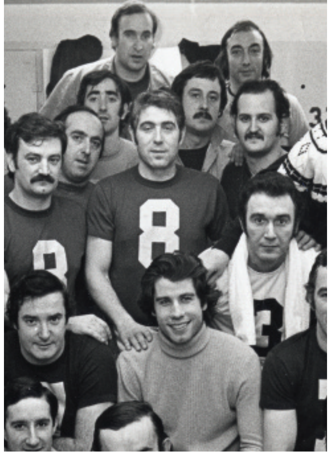
John Travoltarekin. Rokek 8 zenbakia darama.