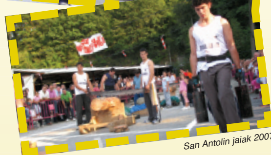
San Antolin jaiak 2007