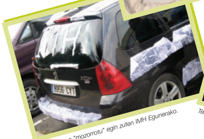
Auto hori ere "mozorrotu" egin zuten IMH Egunerako.