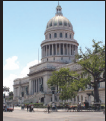
La Habana Vieja, Capitolio