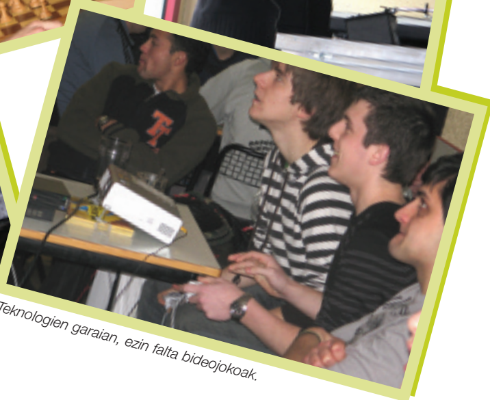
Teknologien garaian, ezin falta bideojokoak.