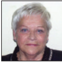
• Zorionak, ama-ama , musu handi bat zure seme-alaben eta biloba guztien partez!