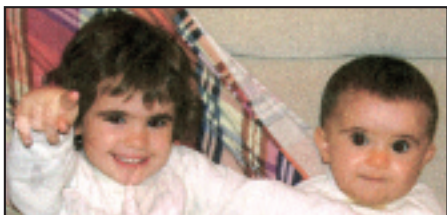
• Zorionak Elder eta Ainitze , zuen aitatxo eta amatxoren partez.