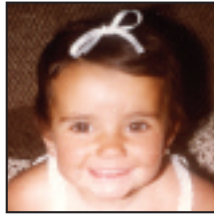
• Zorionak. Presta zaitez datorren astebukaerarako! Depilatu badaezpada ere.