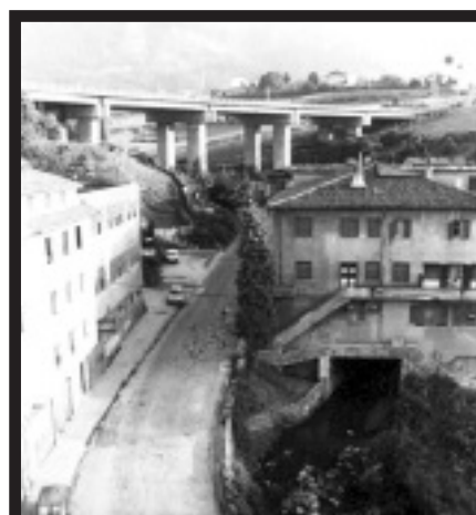
Erreka etxe azpitik pasatzen zen lehen