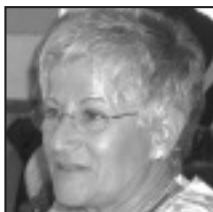
▶ Zorionak zuri, zorionak befi zorionak amama, zorionak befi.