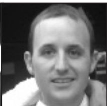
▶ Badakitx eta ezdakitx! Guk badakigu, heldu da bai esateko eguna. Zoriontsu izan. Earki ibiliko gatxik!