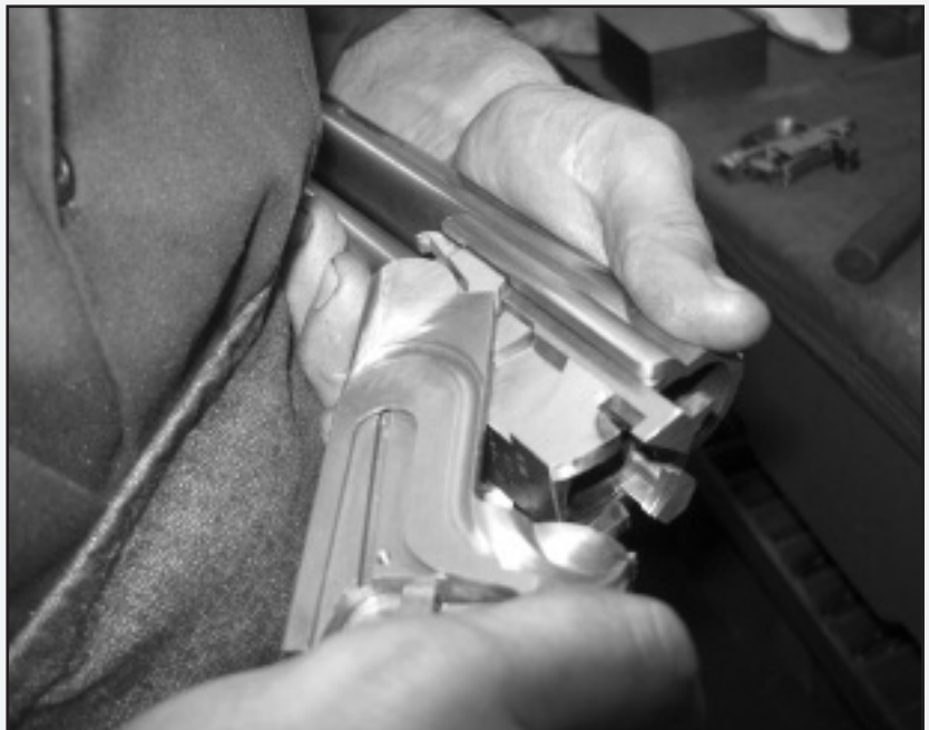
Kemenek eskopetagintzara berrikuntzak ekarri baditu ere, armaginak artisauek erara egiten dute lan.