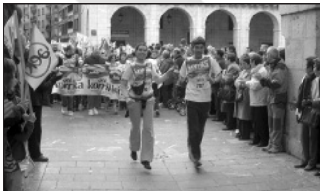
Haritz Euskal Dantza Taldea