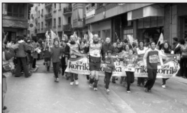
Alkorta Brockhaus - LAB