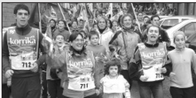
Elgoibar Ikastolako langileak