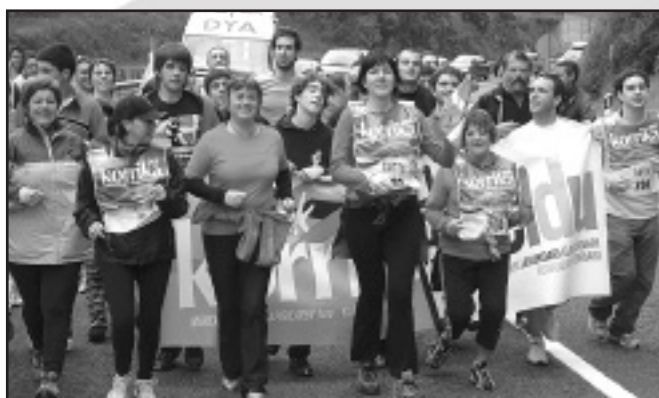
Haizea Emakume Taldea

Martxoaren 25ean pasatu zen Korrika Elgoibartik. Puntu-puntu iritsi zen eta Saturixotik Mendaroraino egin zuten korrika herritarrek euskararen alde. Haur, gazte eta zahar saltaka jarri zituen Korrikak. Kaleak txiki gelditu ziren. Ondorengo hiru orrialde hauetan batu ditugu Korrikako irudiak. Eskerak eman nahi dizkiogu Azkue argazki dendari, zenbait argazki berak utzi dizkigu-eta. Aipatu bestalde, guk ateratako argazkiak www.elgoibarren.net webgunean daudela ikusgai.