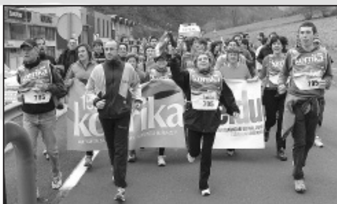
IMH, Haur Eskola, Herri Eskola eta B.H. Institutua