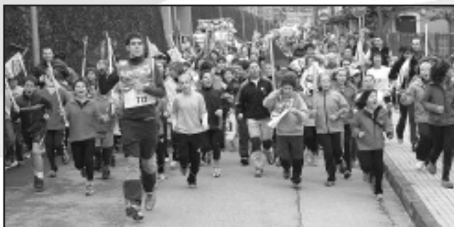
Elgoibar Ikastolako ikasleak