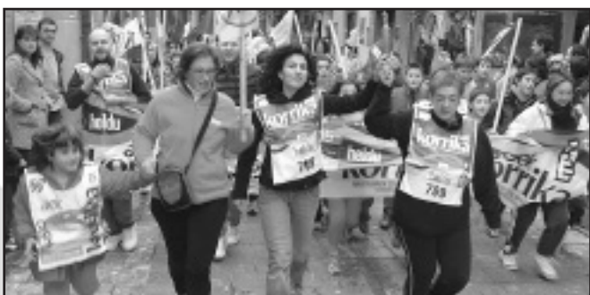
Udaleko Euskara Batzordea