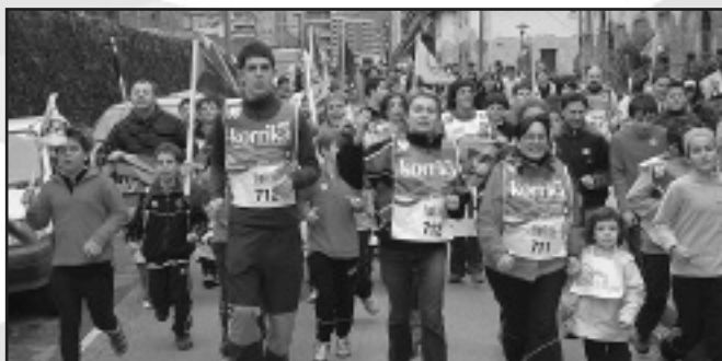
Elgoibar Ikastolako gurasoak