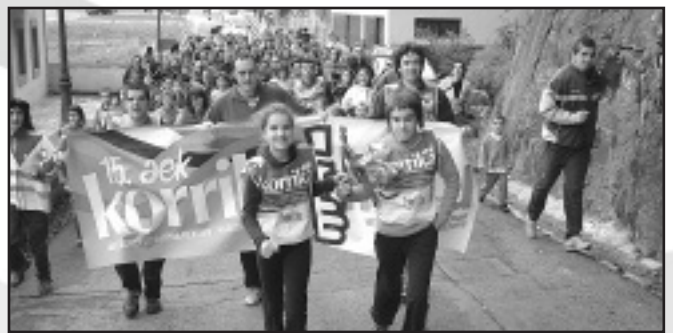
Arno eta ikastola