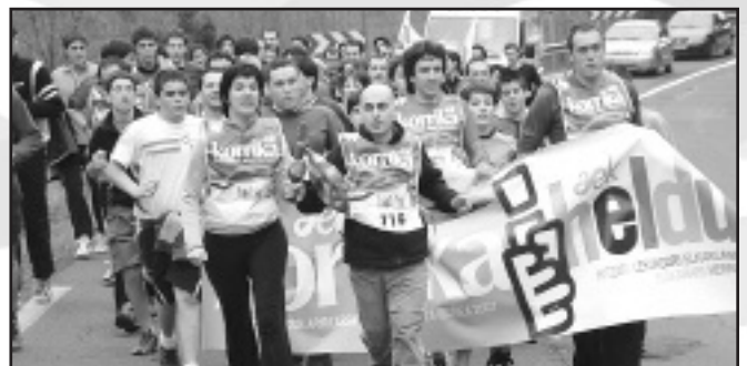
Mendaroko Korrika antolatzaileak