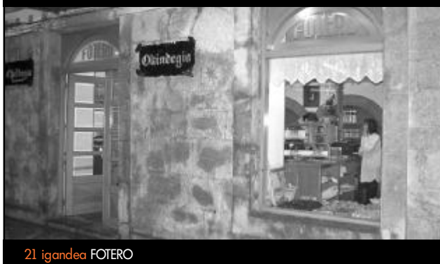
21. igandea FOTERO