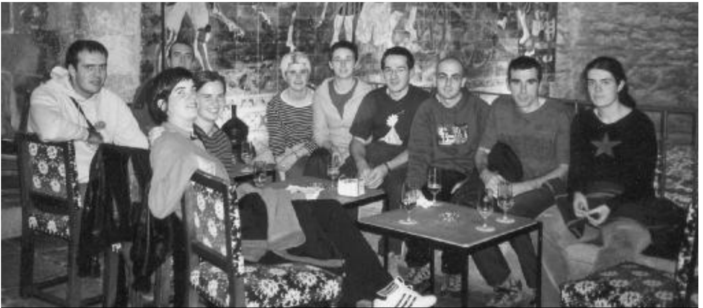
In Leike-ko Euskara Taldeko kideak.

raren alorrean lanik garrantzitsuen ere, beraiek egindakoa da: "Elgoibarko AEK-rekin elkarlanean, euskaltegia sortu genuen Mendaron. Harrera oso ona izan zuen. Orain Udalak dauka horren ardura. Gerora, mintzalaguna egitasmoa jami genuen martxan, eta oraindik ere badabil taldetxo bat programa honetan". Euskara Taldetik, bestalde, Begirale Taldea sortu