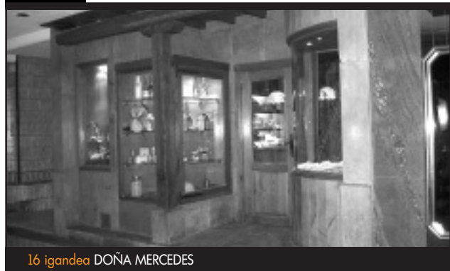
16 igandea DOÑA MERCEDES