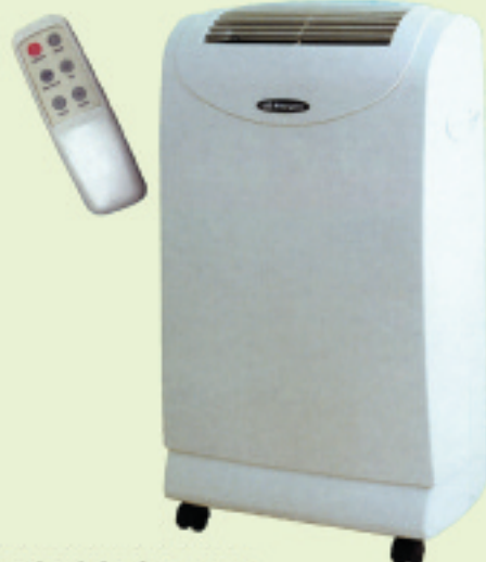
ORGEGOZO ADR32 AIRE EGOKITU ERAMANGARRIA. 3500 frigoria / orduko