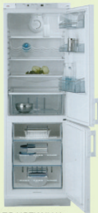
COMBI AEG HOZKAILUA S-3105/8KG. Bi motora. Neurrak: 1840 x 595 x 630 mm. Kristalezko bandeja.