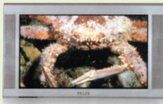
PHILIPS TVC - 32". 100 HZ digital scan. Real flat.