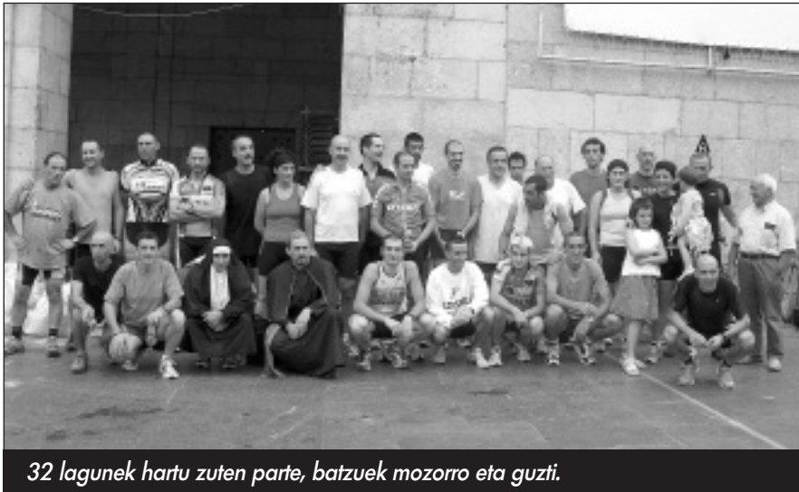
32 lagunek hartu zuten parte, batzuek moztarro eta guzti.