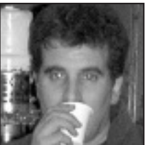
† Zorionak Antionioli Egun zoragarria pasa RTSko gaueko ganoragabekuen partez.