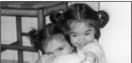
† Zorionak Sorgintxoak! Ondo pasa 3. urtebetzean. Besarkada goxo bat eta muxu potolo bat bioi etxeko guztien partez.