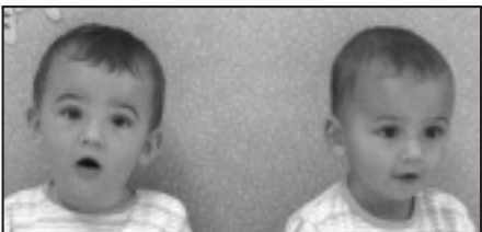
† Zorionak bikote! Lau muxu handi zuen artean banatzeko ikastolako laguntxoaren partez.