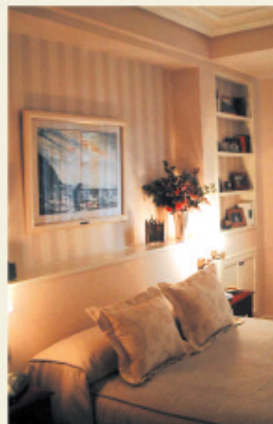
Errosario 15. ELGOIBAR Tel. 943 74 40 19

Proiektu eta erreformak Gremioen zuzendaritza Altzarigintza osoa