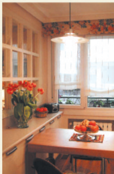
Arragueta 12. EIBAR Tel. 943 20 06 98