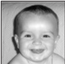
† Zorionak etxeko "terremotoari" 1. urtebetzean. Patxo haundi- haundi bat, amatxo, aiatxo eta June-ren partez.