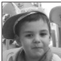
† Zorionak ekainaren 27an 3 urte beteko dituzulako. Familiakoan partez.