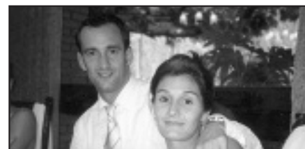
† Zorionak! Guraso, Patri, Betsabe eta Angelen partez. Ondo pasa!