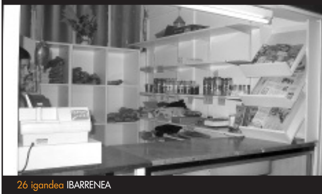
26 igandea IBARRENEA