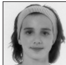
† Zorionak Itxaso hilaren 16an 14 urte bete zenituelako. Etxekoan partez.