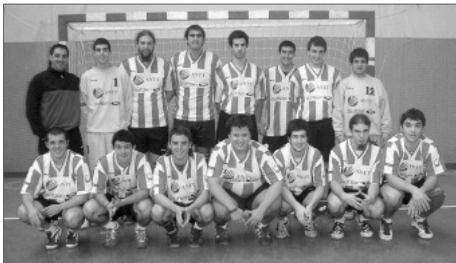
ANTT Sanlo (Senior mutlak)