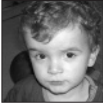
† Martxoaren 29an bigarren urtebetetze zorionsua igaro dezazula opa dizugu. Ikastolako laguntxoak.