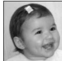
† Zorionak June ri martxoaren 1ean urte bat bete zuelako eta Norari martxoaren 7an 5 urte bete zituelako. Familiakoen, eta bereziki beraien lehengusuen partez.