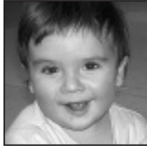
† Martxoaren 21ean urtebetetze zorionsua igaro dezazula opa dizugu. Ikastolako laguntxoak.