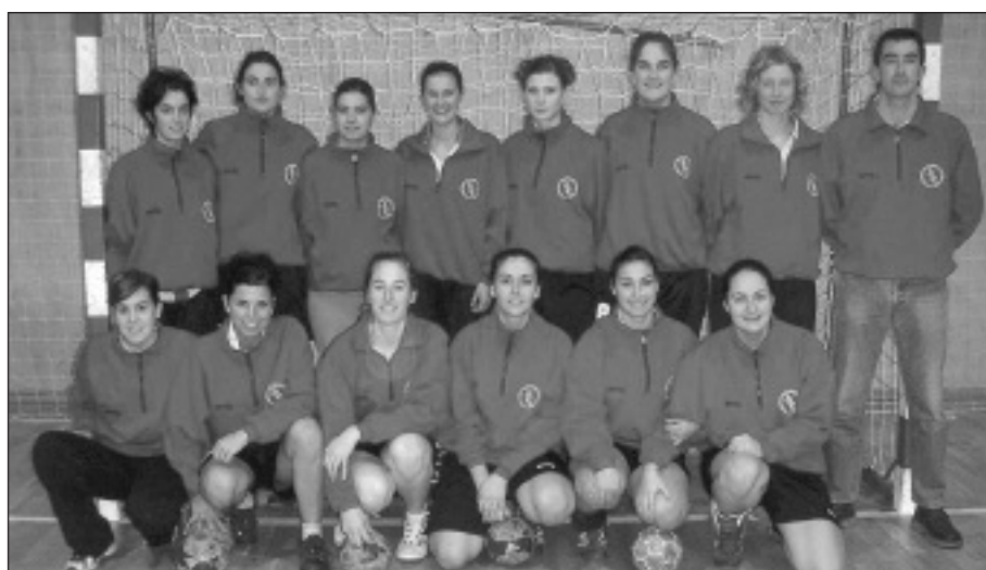
Sanlo (Senior neskek)