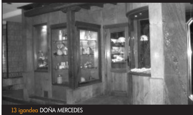
13 igandea DOÑA MERCEDES