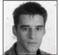
† Zorionak Itakil Gurasoen eta anaien partez.