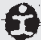
† Etor , zuri ongi-etori neska artera, eta Guru eta Giller-i muxu handi bat zazpi ipotxen partez.