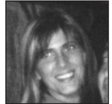
† Ikusten duzun bezala ez gara zutaz ahaztu. Zorionak Plantxil Tragotxo baten zain gelditzen gara, txipirona!