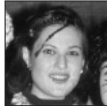
† Zorionak Elgoibarko neska politxena! Txipirona!