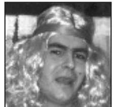
† Zorionak Rubial! Ea aurten ere horrelako guapa ikusten zaitugun. Zorionak! ja, ja, ja...