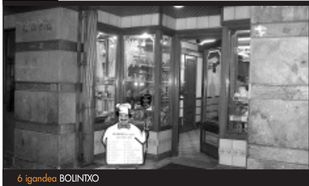
6 igandea BOLINTXO