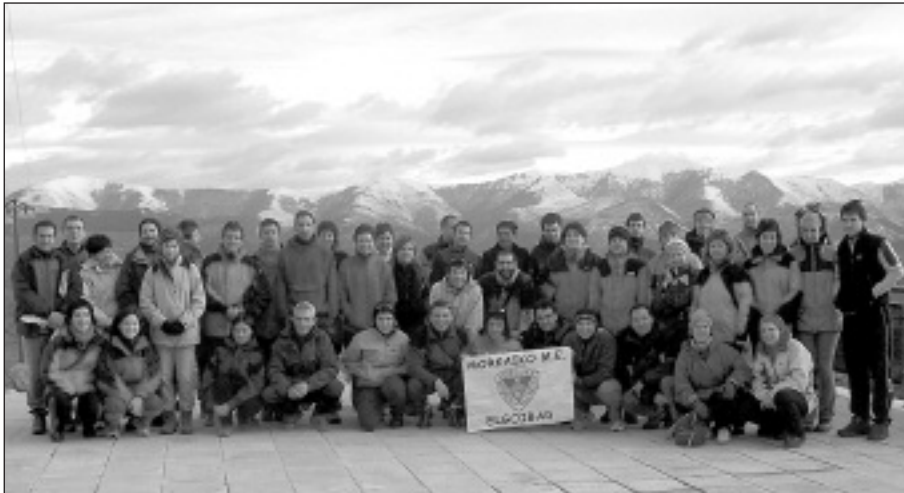
Hurrengo irteeran mendia eta parranda uztartuko dituzte.

B izkaia eta Kantabria arteko mugan dagoen Karrantzako bailara ezagutu zuten Morkaiko Mendizale Elkartearen azken irteerara joan ziren 46 lagunek. Eguraldiak bista ederretaz gozatzeko aukera eskaini zien: ipar aldean itsasoa eta hegoalderantz Karrantzako bailara berdea, Zalama, Balgerri eta Ansoneko mendi elurtuak. Bost orduko ibilbidea burutu ostean, Pozalaguako haizuloa bisitatuz amaitu zuten eguna.