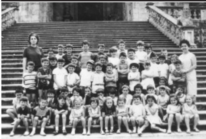
1. etapa: Ikastola asentatzea eta indartzea izan zen Elkartearen lehen zeregin garrantzitsua

etapatan banatu du kontakizuna: bata, 1963-1990 urte bitartekoa, eta bestea 1991-2004. Azpian ikus dezakegu etapa bakoitzetik ateratako erretratu bana.