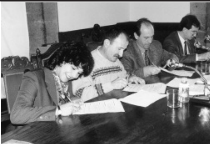
2. etapa: Gurean Bai hitzarmenaren bidez, herriko sektore diferenteen konpromisoa bultzatu nahi du Elgoibarko Izarrak