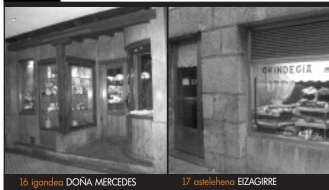
16 igandea DOÑA MERCEDES