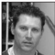
♦ Zorionak zapatari guapoenari gaur, hilak 26, bere eguna delako.