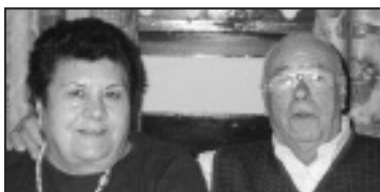
♦ Zorionak zuen urrezko ezteietan. Familiako guztiaren partez.