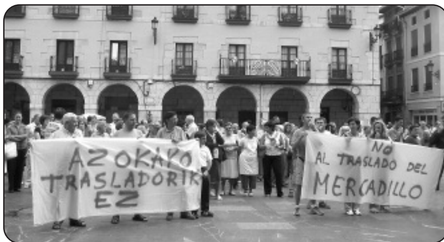
Herritar ugari bildu ziren azokaren leku aldaketaren kontrako manifestaldian.

Udaletxetik jakinarazi dutenez, herrian sortzen diren trafiko arazoak konpontzeko hartu dute erabakia. Azokako merkatariak, ordea, arrazoi hori aitzakia bat besterik ez dela diote: "Orain arte ez digute arrazoirik eman, eta zerbait esan behar zuten, trafiko arazoa jarri dute aitzakia modura. Udalak borondate apur bat izango balu, trafiko arazoa konpontzeko beste moduren bat bilatuko luke".