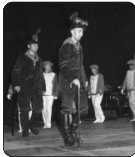
Goian Haritz EDT. Behean eta ezkerrean Maltako taldea. Eskuinean, hungariarrak.