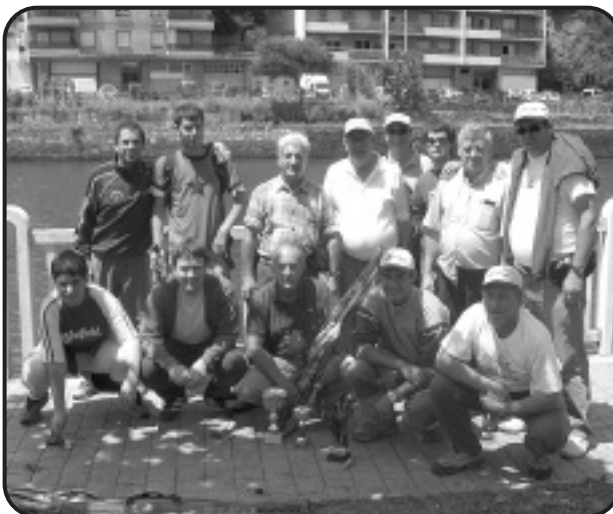
Parte hartzaileak Debako Alamedan.