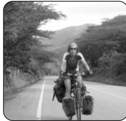
Hegoamerikan eta Ertamerikan paisaia ikusgarriak aurkitu dituzte.

Murgiaraino (Araba) joan ziren. Lagun batzuk bila joan zitzaizkien, eta azken etapatxoa furgonetan egin zutela kontatu digute.