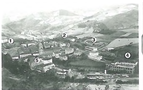
Udaleko arribategiko argazkia

1933. urtean begira nolakoa zen Elgoibarko herria. Zer nolako aldaketa jasan duen 68 urtetan. Herri txikitxo bat izateko, ordea, biztanle kopuru altua zuen garai hartan. Orduko erroldak dionez, 5.328 lagun bizi ziren Elgoibarren, oraingo erdia, gutxi gorabehera. Inguruetan ere gaur egun baino baserri gehiago zeuden. Argazkia ikusterakoan konturatuko zineten bezala, artean ez zegoen Sigmako fabrikarik. Arraroa ere egiten da Elgoibar Sigmarik gabe imajinatzea, ezta? Hona hemen erretratuan ikus ditzakegun 5 leku ezagun: