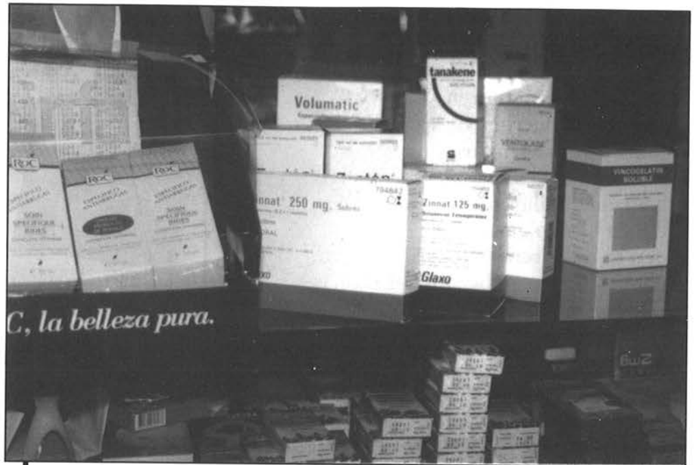
↳ Urtean zehar, errezetadun 15-20 larrialdi bakarrik izaten dituzte herriko farmaziek.

Bailarako txanda sisteman arabera, zortzi astez osatutako egutegia osatu dute. Lehen lau asteetako txandak herriko lau farmaziek egingo lituzkete, bakoitzak aste batean. Ondorengo hiru asteetakoak Plaentxiko farmaziek egingo lituzkete eta gaintzeko astekoa Mendaroko farmaziak. Zortzi asteak egiten direnean, Elgoibarko farmaziak berriro hasiko lirarteke errondarekin. Herri-tarrek, beraz, otsailera arte ez dute kanpora joan behar-ko botikak erostera.