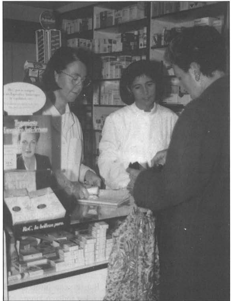
Txanda berriekin, botikak herritik kanpo erosi beharko dira.

Txandak bailaraka egiteak, gaueko eta igande arratsaldeko goardietan soilik izango du eragina.