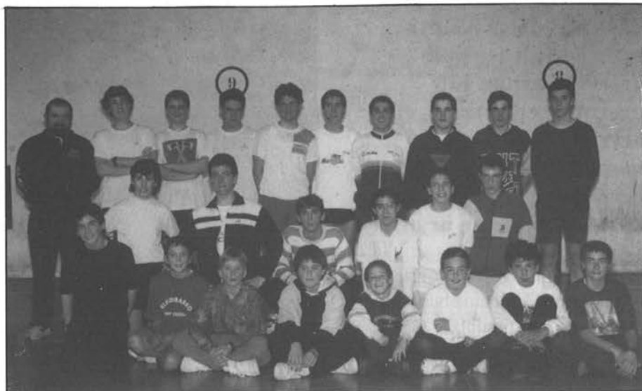
← Neguko entrenamenduari gogor ekin diote Lagun Taldeko txirrindulariek.