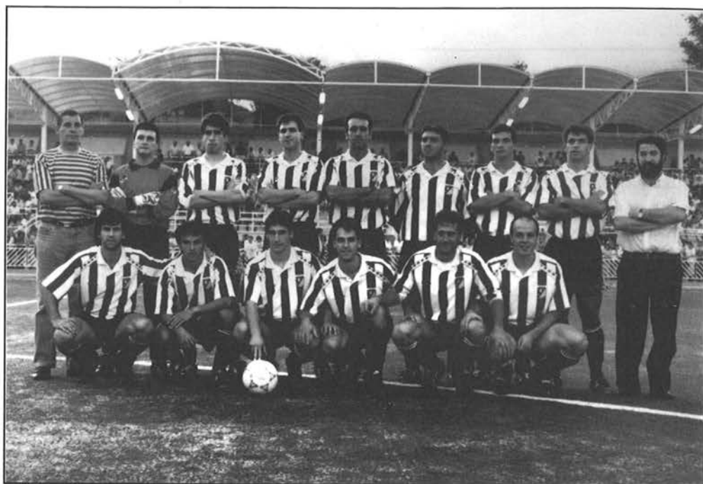
➔ C.D. Elgoibar Kirol Elkartearen futbol taldea gaur egun.