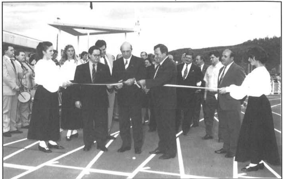
Asteazken arratsaldean inauguratu zuten Mintxetako Udal Kiroldegia.

Instalakuntzak erabili ahal izateko ezarriko diren prezioak oso merkeak izango dira eta beharbada Kiroldegiko bazkide direnentzat, prezioak zertxobait merkeagoak izango dira. Mintxeta barrura ezin-go da ez txakurrik ez bizikletarik sartu.