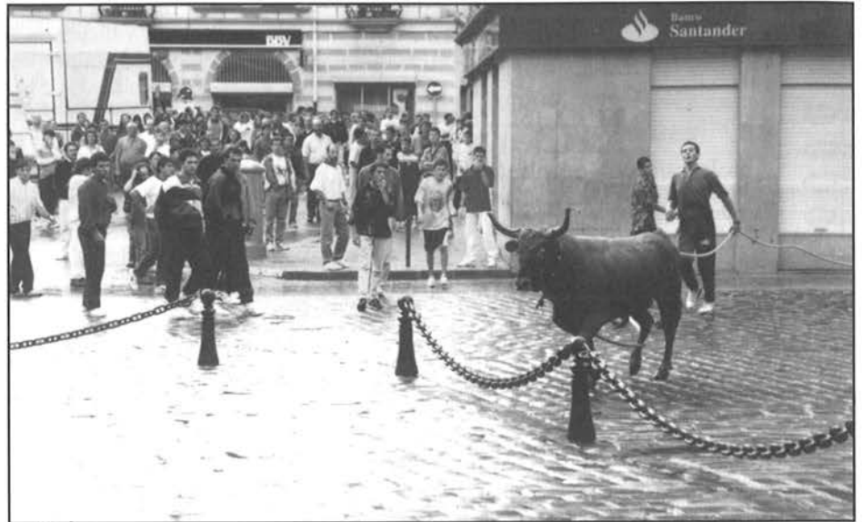
← Jaietan arrakasta gehien duen ekintza, dudarik gabe, sokamuturra da.

Jaietako erresakak atzean laga ondoren gertatutakoaren azterketa egiteko ordua etorri da. Aurtengo jaiak iazkoak baino hobeak ala txarragoak izan dira?. Galdera honi erantzun nahirik, Kultur Teknikariak jaien gorabeherak aztertzen dituen txostena kaleratu du.