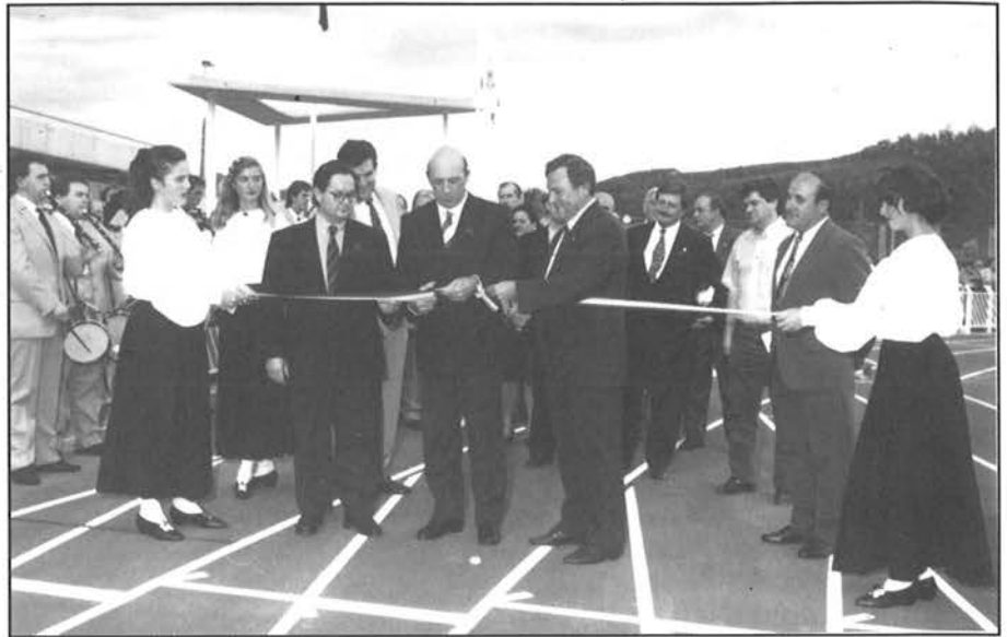
Asteazken arratsaldean inauguratu zuten Mintxetako Udal Kiroldegia.

Instalakuntzak erabili ahal izateko ezarriko diren prezioak oso merkeak izango dira eta beharbada Kiroldegiko bazkide direnentzat, prezioak zertxobait merkeagoak izango dira. Mintxeta barrura ezin-go da ez txakurrik ez bizikletarik sartu.