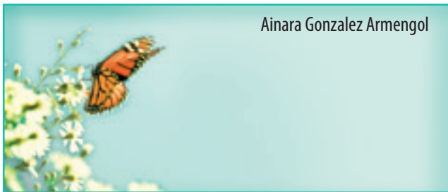
Ainara Gonzalez Armengol