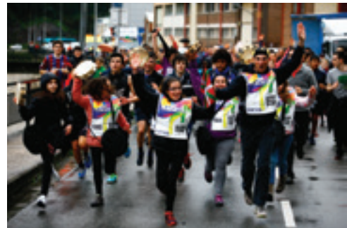
Musika eskola eta abesbatza