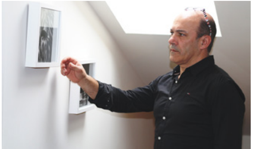
Etxeo paretean ditu saritutako hainbat argazki.

Autodidakta izan naiz erabat. Egin dut photshopeko ikastaroren bat baina, batez ere, eginaz ikasi dut. Denborarekin begia fintzen joaten da eta burua horretara egiten. Hori bai, gogoia izan behar da gauza berriak fotografiazteko, originaltasuna bilatzeko ikuspegian, ordenagailuaren aurrean jarri eta argazkiak aukeratzeko. Gustatu egin behar zaizu. Neri teknika baino gehiago argazkia inte-