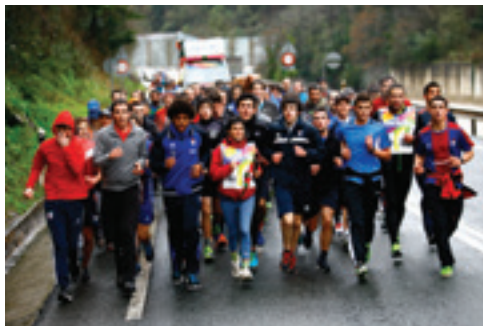
Pil-Pilean Euskara Elkarte

Korrikak irudi ederrak laga ditu herritik pasatzerakoan. Soraluzen euskahaldunak etorkizun oparoa du bizi-poz horrekin. Aldizkarian ezin izan ditugu argazki denak sartu, baina Plaentxia.eus-en daude ikusgai.