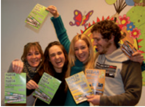
Kosta ala kosta udalekuen aurkezpena.

Kukumixok umeendako asteburu pasa antolatu du maiatzaren 9 eta 10erako. Ume gaiztoen festa Lasturko aterpetxean egingo da 1.mailatik-6.mailara arteko umeendako. Izena apirilaren 15etik 22ra