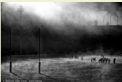
1.ngo saria Bergara BN-n eta Kirolgin. 2. saria Valladoliden.