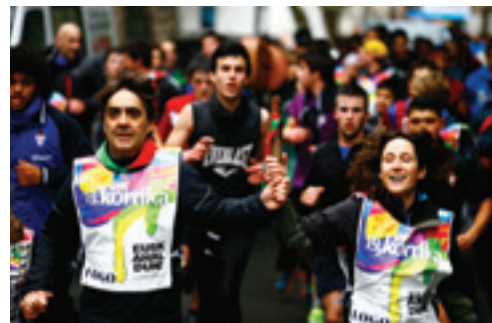
Atxolin eta Keixeta Gurasoen Elkarteak