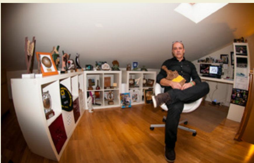
Ganbarako bulegoan, Argizaiola eskuetan.

Ez. Nik horrela asko gozatzen dut. Sekulako askatasuna dut eta nahi dudana egiten dut. Horri eutsi nahi diot.