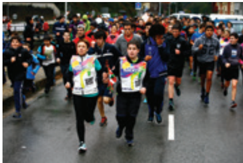
Ludoteka eta bertso eskola