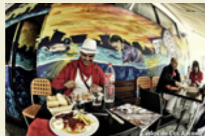
Finalista San Ferminetako nazioarteko lehiaketan.