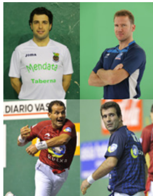
Omenaldian lehiatuko diren pelotarietako batzuk.

Jaialdia 20:00etan hasiko den triki-poteoarekin borobilduko dute eta, ostean, Txurrukara joango dira afaltzera. Txartelak Iratxo goxodendan erosi ahal izango dira bihar hasi eta apirilaren 15era bitartean, 33 euroan (umeei 10 euro).