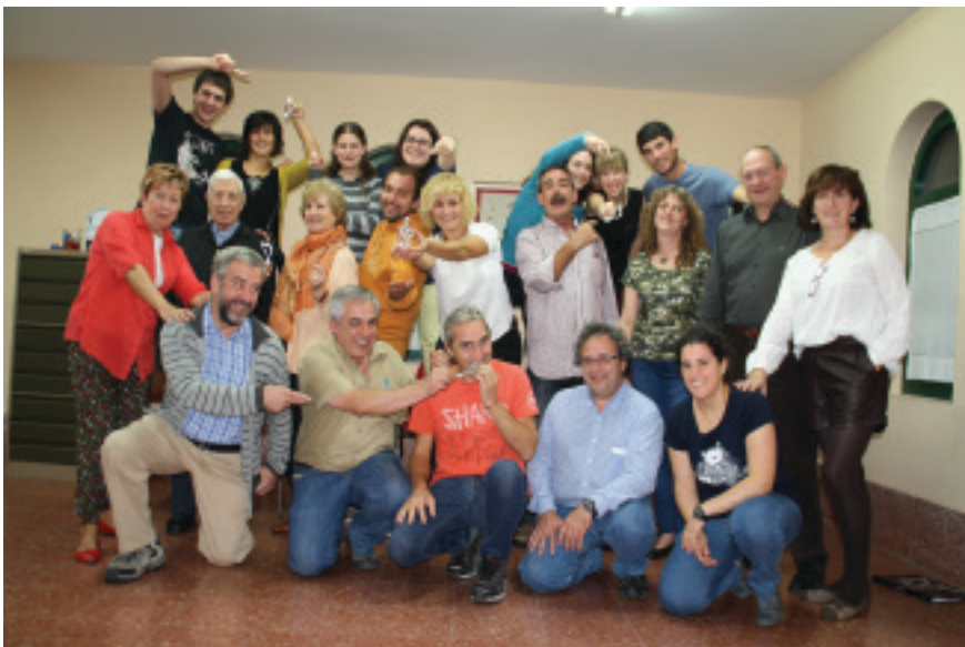
Abesbatzako kideak entsaioan.

Ezoziko Ama abesbatzak herriko kantuzaleei abesbatza ezagutarazi eta bere entseguetan parte hartzeko eskaintza berezia egitea erabaki du.