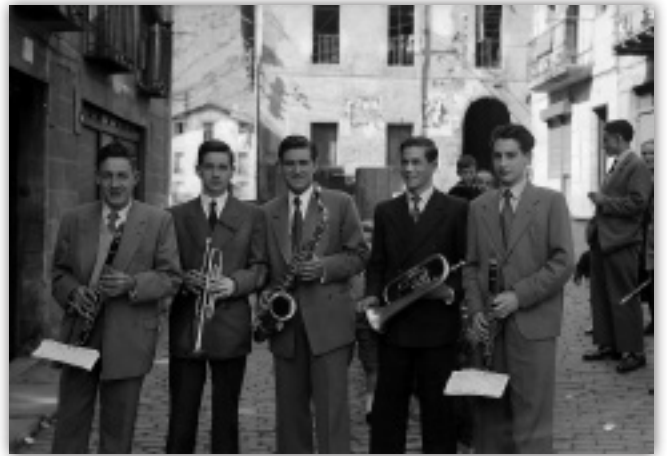
Informazioa: Domentx Uzin.