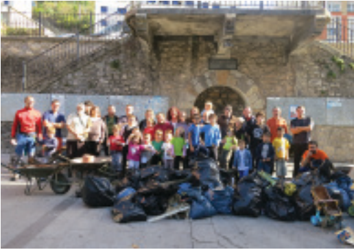
Ibaia garbitu zuen boluntario taldea

Plaza Zaharretik Gaztetxe aldera eta Ezoz Etorbidetako errotondaraino garbiago dago orain, Deba ibaia. Ume, gazte eta heldu, berrogei lagun inguru batu ziren aurreko zapatuan ibaia garbitzeko saioan, eta, guztira, 1000 litroko hiru zaborrontzi bete zituzten. Jasotakoa "batez ere, etxeko hondakinak dira, eta ez