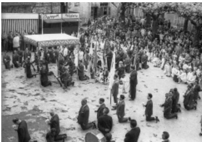
Gorpuzti prozesioa (1964-05-28)