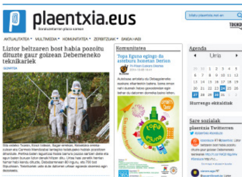
Webgune berriaren zirriborroa.

Internet zuhaitzez betetako ohian zabala da, edo, nahiago bada, galaxiaz betetako unibertsoa. Erraza da batetik bestera joatea baina baita galtzea ere. Aurkeztu berri dute euskal komunitatea ohian edo unibertso zabal horretan kokatzeko baliagarri izango den tresna: .Eus domeinua. Urtea amaitu au-