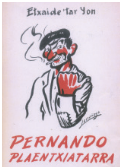
Pernando Plaentxiarra liburuaren azala

Pernando amezketarra jaio zeneko 250. Urteurrena ospatu den honetan, Pernando plaentxiarra (Jon Etxaide, 1957) liburuaren eta herriko umorearen nondik