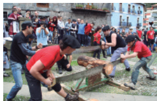
lazio herri kirol proba

Gaztetxeak antolatuta, herriko gazteek eta Bergarako gaztetxeko ki-deek desafioa jokatuko dute Gaztañerre azokan, 11:30ean Plaza Barrixan. Hamar laguneko bi taldetan banatuta (5 neska eta 5 mutil) elkarren aurka arituko dira zein baino zein, herri kirolak praktikatzen. 5 modalitatetan neurtuko dituzte indarrak: trontzan, lokotxak batzen, ingudean, txingetan eta sokatiran.