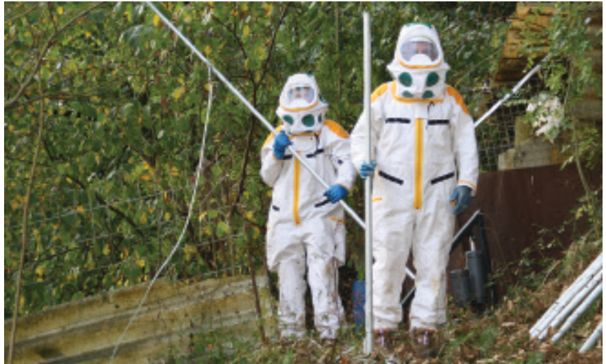
Debemeneko teknikariak Txarako habiaren azpian.

Liztor beltzaren bost habia pozoitu zituzten atzo herrian. Urtea hasi zenetik, Debabarrenean 80 inguru kendu dituzte eta 700 bat Gipuzkoan. Teknikariek uste dute datorren urtean egoerak okerrera egin dezakeela.