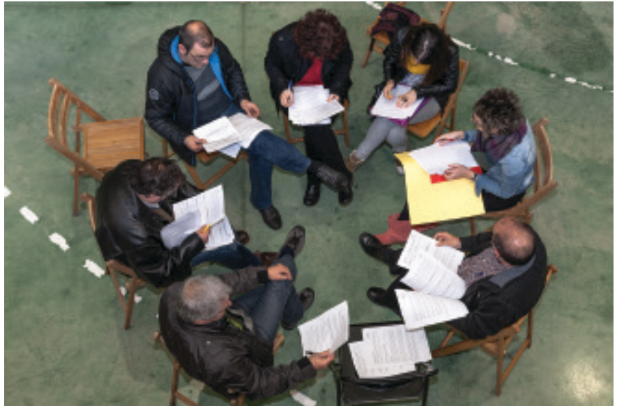
Alkarrekinen lan-talde bat, eztabaidan

Azaroaren 22an, zapatuan, Alkarrekin Soraluze Eginez prozesuaren Batzar Orokorra egingo da Kiroldegian. Batzarrean, proiektuetako kideek eta udaleko teknikariek datorren urterako prestatu dituzten egitasmoak aurkeztuko dituzte.