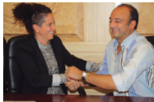
Alkatea eta Sorako lehendakaria hitzarmena sinatzen