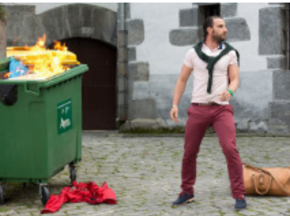
“Ocho apellidos vascos” pelikulako fotograma