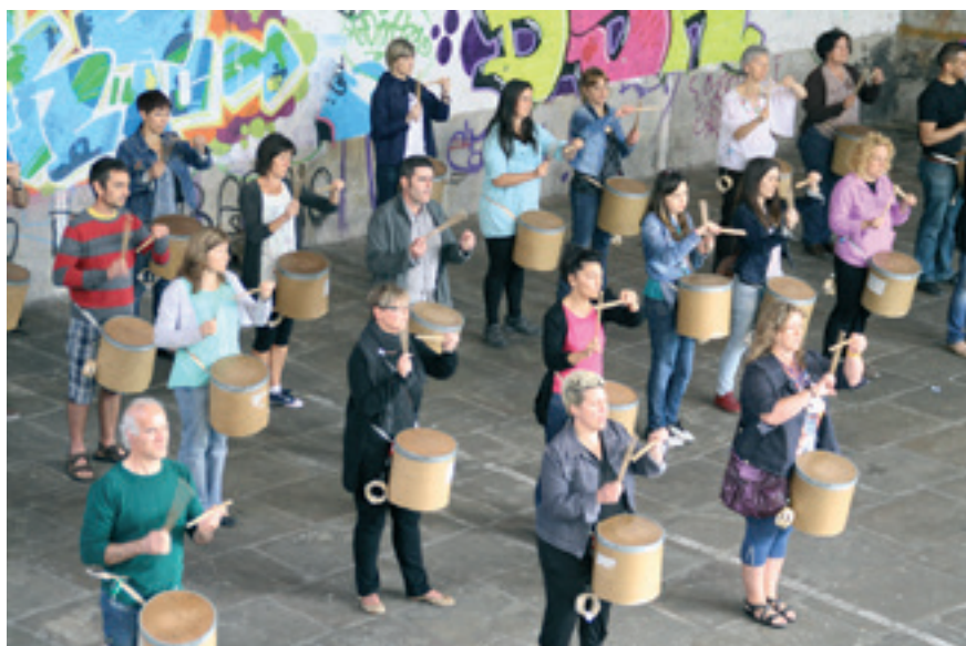
Danborrada da jaietan parte hartzerik handienetakoa duen ekimena.

Una noche con los Beatles , Erandioko Banda eta Gaubela taldea dira gasturik handiena suposatzen dutenak.