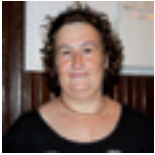
Zorionak polittori! Plazer bat da zu ezagutu izana. . . Urte ederra izan deizula eta muxu haundi asko, Pil-eko lagunen partetik!