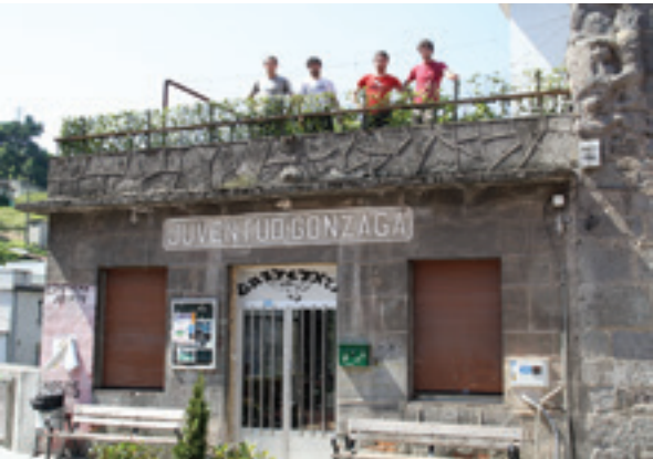
Gaztetxeko kideak sabaieko lanak zehazten.

Maiatzean argia moztu zietenetik itxita egon da Gaztetxea. Argindarraren instalazioan arazoak zirela eta, lberdrolak argindarra moztu zien maia-