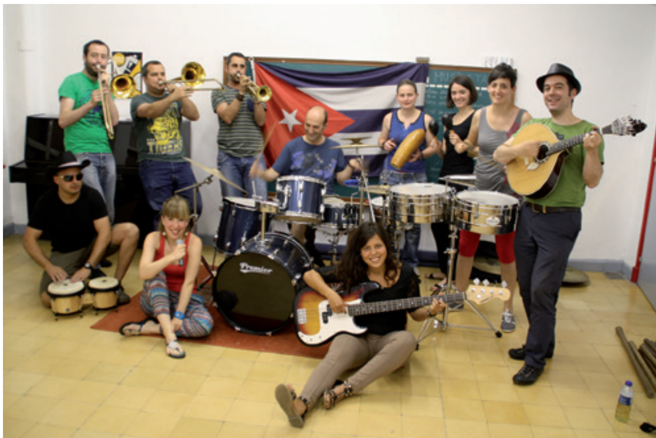
Kubari eskainitako ikuskizunean jardungo duten musikarietako batzuk.

Gustuen arabera ugaritu dira guneak eta ikuskizunak herriko jaietan, baina estimatuenak herrian bertan eta herritarrek ekoiztutakoak dira.