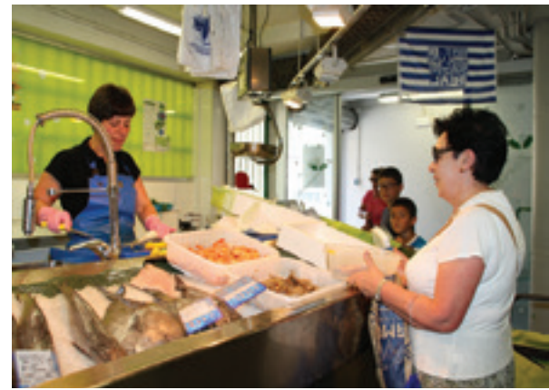
Arraindegian erosketak tupperrarekin egiten.

Jasangarritasun taldeak positiboki baloratu du uztailaren 5ean egin zen Ingurumen Eguna ere. Egun guztian zehar azoka ekologikoan eta zenbait produktu ekologiko egiten ikasteko tailerretan sortutako giro ona eta izan zen