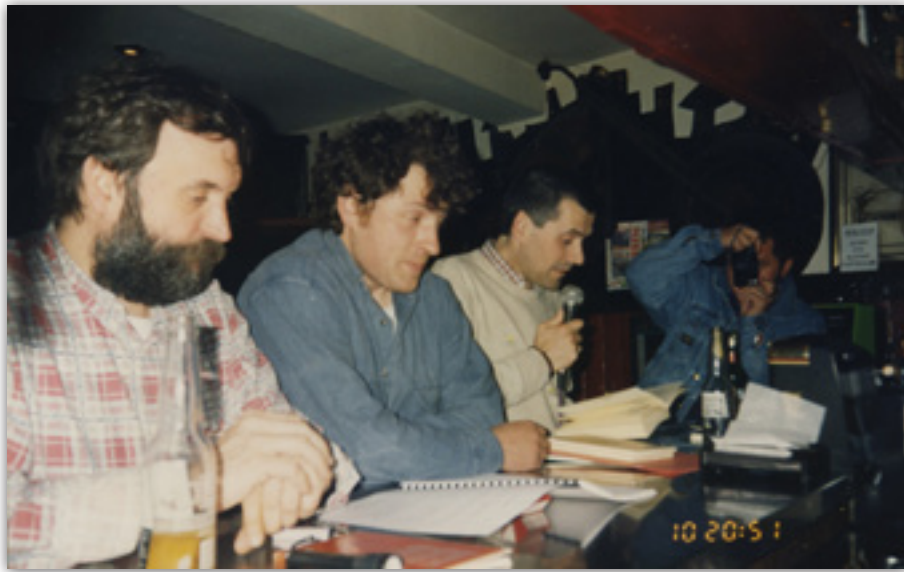
Iturria: Kristina Laskurain.