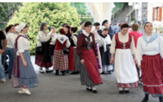
Erromerixa eguna, ia.

lejiran. Goizeko dantza saioaren ostetik, bazkaltzeko etxeetan eta elkarte gastronomikoetan banatuko dira umeak eta arratsaldean berriz alardea dantzatu dute Plaza Zaharrean. Ekainaren 14rako zehaztu dute, bestalde, aurten go Erromerixa Eguna. Goizean Plaza Barrixan salda eta txorizoa hartuta, Ezozira kalejiran joango dira eta bertan dantza saioa eskainiko du Urratsek. Bazkalorduan ermitako atari eta inguruetan bazkaltzeko aukera izango da (lekua hartzeko Iratxo goxodendan eman behar da izena). Bazkalostean Xero Xiettek dantzarako ohikoak diren doinuekin alaituko du Ezoziko jai-giroa.