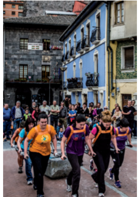
Emakume proben entrenamenduek ikusmina piztu dute.

Castellersak zapatu goizean helduko dira herrira eta herriko elkarrekin bazkalduko dute: Allegroan, Mahastian, Lagun Maitean eta Arranoan. Arratsaldean giza-dorreak egin ostean udal-pilotalekuan egingo dute lo. Hurrengo egunean