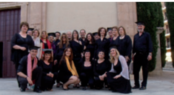
Irudian, Salamanca abesbatza.