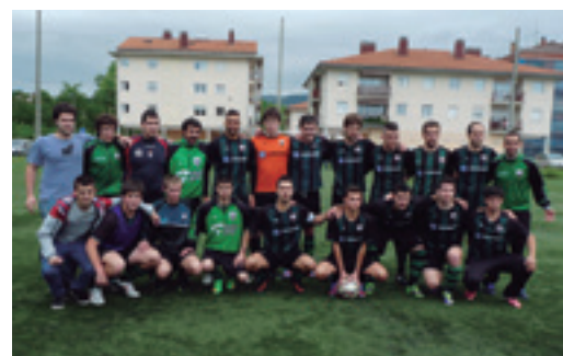
Erregional taldearen hamaikakoa.

2-0 galdu zuten Gipuzkoako Kopako finalerdia Oiartzun taldearen aurka, eta, ondorioz, finala jokatzeko aukerarik gabe geratu da Erregionala. Partida zaila izan zela, eta oiartzuarrak hobeak izan zirela azaldu dute zuzendaritzatik. Ekainaren 14an Soraluze Futbol Taldeko jokalaria, entrenatzaile, zuzendaritzako kide eta klubeko arduradunek denboraldi amaierako afaria egingo dute. Mahaiaren bueltan ehun lagun inguru batuko dira, eta afal ostean denboraldiko jokalaria erregularrenak eta goleatzaileenak sarituko dituzte.