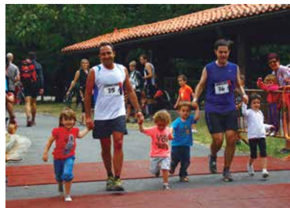
Parte hartzaile batzuk helmugara iristen iaiko lasterketan.

Parte hartzaileek lasterketa hasi aurretik eman ahalko dute izena, 8:30ak eta 9:15ak bitartean, San Andreseko frontoian. Aurretik, www.kirolprobak.com