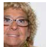
Soledad del Bosque Ordezkarri instituzionala

Lehenengo momentutik prest egon gara prozesu honetan parte hartu eta gure ekarpena egiteko, herritarrekin eta herriko eragileekin batera etorkizunean zelako Soraluze nahi dugun erabakitzeko.