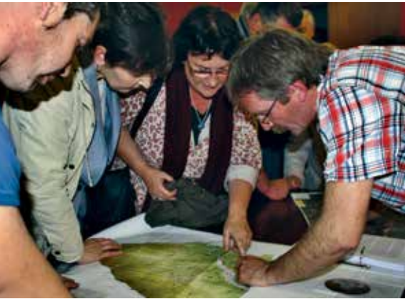
Baserritarrek arreta handiz begiratu zioten baserribideen mapari.

Herriko baserribideen inbentarioa osatu du udalak, Debemenekin batera. Udalaren helburua da "baserribideen jabetza, erabilera-eskubide eta mantentze-lanen ingurukoak zehaztea eta ondoren ordenantza batean jasotzea".