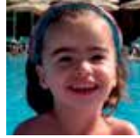
Lide Sudupe Uztailan 1ian 3 urte! Zorionak poxpolintxo eta muxu haundi bat danon partetik!