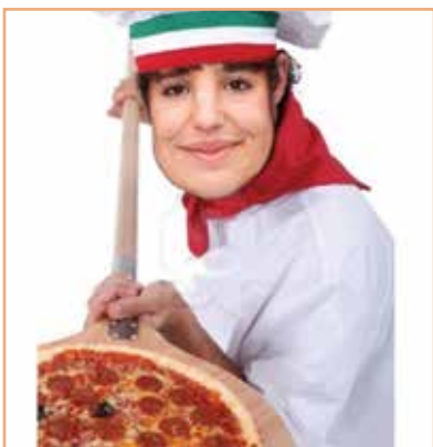
Saria: Argia Mihiluze mahai jokoa.

Oharra: Lehiaketako irabazlea aukeratzeko zozketa alea etara eta hurrengo barixaku eguerdian egiten da.