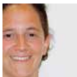
Hiart Arluziaga Ordezkarri instituzionala

Herriaren etorkizuna hausnartzeko prozesua da. Ez da erronka makala eta herritarrek izango dira prozesuari edukia emango diotenak. Parte hartzea gora doa, ekarpen asko jasotzen ari gara eta herriarendako aberasgarria izango delakoan nago.