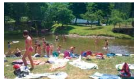
Aulestiko parkea bisitatu zuten iaz.

ez ezik, Euskal Herriko txoko ezberdinak ere ezagutuko dituzte eta aurreratu dutenez, uztailearen 19an, sormena kalera atera eta festa giroan arituko dira herriko kaleetan zehar. Herritarrei festarekin bat egiteko gonbidapena luzatu nahi diete.