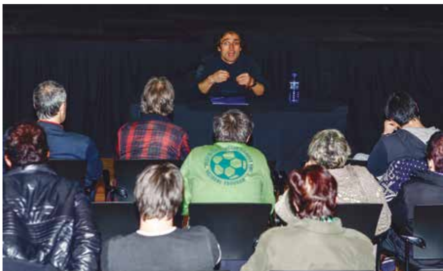
Sarasua, eguaztenean eman zuen hitzaldian.

Krisia aldatzeko aukera paregabea ere bada.