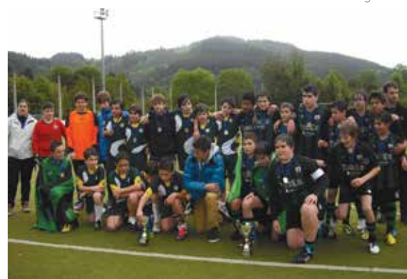
Infantilak garaipenez harro, San Patriciokoekin ateratako argazkian

Finalerdietako joanekoan 4 eta 2 galdu arren, itzuliko partidatan 4 eta 2 gailendu zitzaio talde zestoarrari eta penaltiei esker sailkatu zen talde plaentxiarra finalerako. Zapatuan jokatu zuen Idiazabalen Kopako finala San Patricio donostiarren kontra, eta 4 eta 1 irabazi ostean, Kopako txapeldun izan da Sorako Mutilen Infantil taldea. Ibai Tajuelok sartu zituen finaleko lau golak eta pozaren pozez, herrira etorri eta udaletxeko balkoira igota ospatu zuten lortutako garaipena.