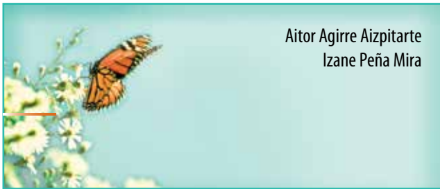
Aitor Agirre Aizpitarte Izane Peña Mira