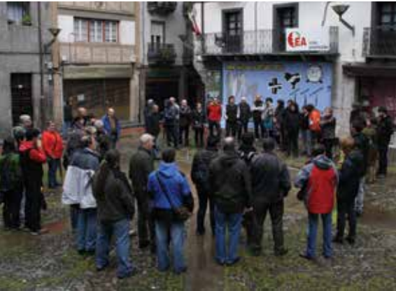
Manifestazioaren ostean Plaza Barrixan.