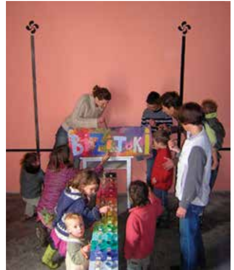
BiziToki elkarteak Iparraldean abiatu duen esperientzia azalduko du.

kuen bideoa; 24an, barixakua, "Klariona" umeendako antzerkia (3-6 urte); 27an astelehena, Hezkidetzatza tailerra; 30ean, eguena, Gaztetxearen papera hezkuntza ez formalean.