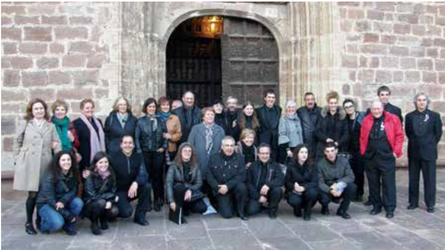
Ezkaraira egindako irteeran ateratako argazkia, irudian.