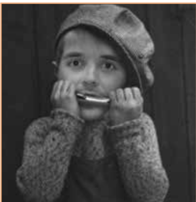
Saria: Argia Mihiluze mahai jokoa.