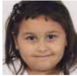
Aiara Cortes Zorionak tiki eta patxo haundi bat etxekoan partez!