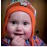
Irati Oregi Apirilaren 10ean urtebete Segi etxean irribarreak sortzen! Zorionak preioxal! Etxekoan partez.