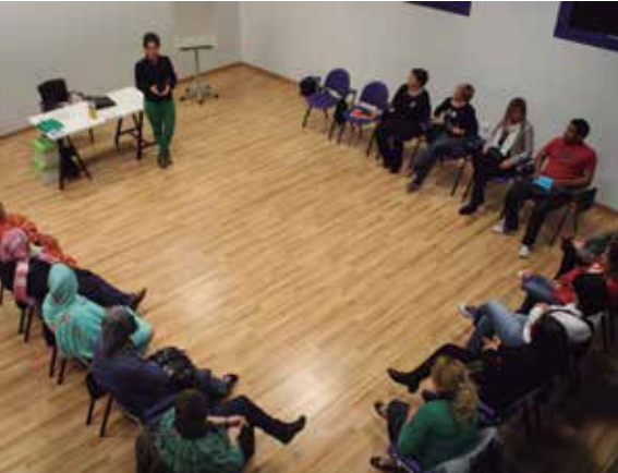
Formaziorako eskolak antzokian.

Enpleguasustatzeko Debabarrenean garatu den Enplegu Planak Soraluzei, bailara mailan langabe tasa altuena duen udalerriazategatik, formazio programabataratzeko dirulaguntza esleitu dio udalari, eta