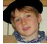
Aupa Peio! Gure etxeko haundixenak 7 urte egin dittu!! Mila zorion, muxu eta besarkada!!