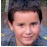
Xabat Deza Abenduan 27xan 9urte Muxu haundi bat Argateko familixian partez!