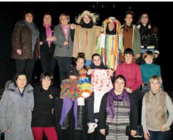
Egitasmoan parte hartu duten eragileetako ordezkariak.

Aurten haur eta lehen hezkuntzako neska-mutikoek Euskal Aratosteak ospatuko dituzte eta kalera ere aterako dira kalejiran aratusteetako