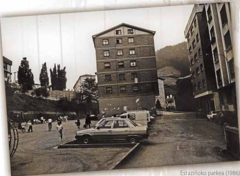
Estaziño parka (1986)