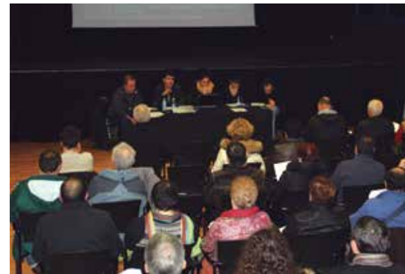
Zinean burutu zen udal aurrekontuen aurkezpena.

dendetan kontsumitzeko bonolaguntzak banatzea, merkatu plazako kultur erabilerrako egoitza zabaltzea, herriguneko asfalto konpontzea, hirugarren sektorea biziberritzeko plan estrategikoa, gaztetxokoa zabaltzea eta kiroldegi gainerako beiratearen irekiera aipatu zituzten besteak beste. Bestalde, eragileendako banatzen diren dirulaguntza guztiak bere horretan mantenduko direla ziurtatu zuen Arluziagak.