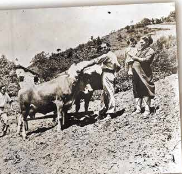
Soroa goldatzen (Arritxa?)