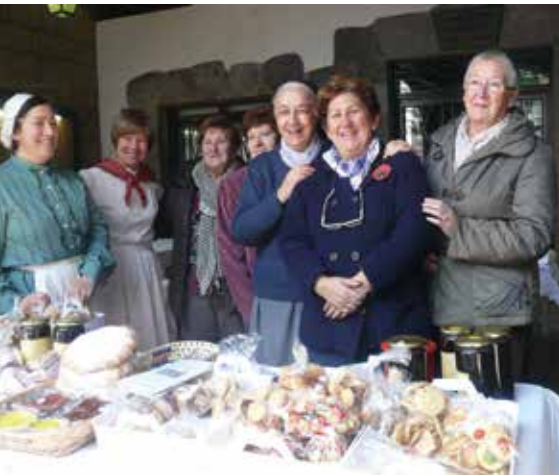
Misio taldeko kideak, Gaztañerretako postuan.

Urik gabe ez dago bizitzerik lemapean, Haitiko Lavenneau - Jacmel herrialdean 2008ko uholdeek sortutako ezbeharrak konpontzen laguntzeko 3.252 euro batzea lortu du Soraluzeko Misio Taldeak. Jasotako dirua aipatu herrialdeko ur-bideratze lanak egin eta azpiegiturak berreraikitze erabiliko dute. Azaldu dutenez Haitin, asko dira oraindik ur edangarririk ez duten eskola edota erietxeak, eta kanalizazioak egin ahal izateko 19.999 euro behar dituzte. Diru kopuru hori lortze bidean aurrerantzean burutuko dituzten ekimenetan parte hartze-ko deia luzatu nahi diete herritarrei.