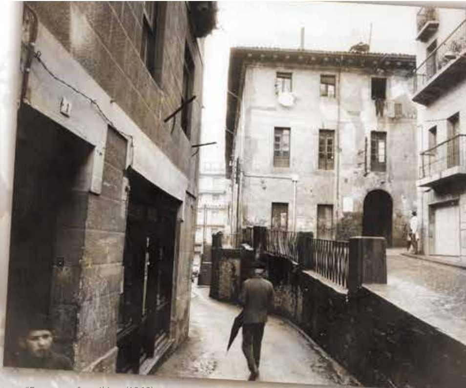
"Erregetxe" eraikina (1969)