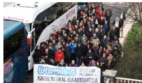
Bilboko manifestaziora lau autobus joan ziren.

batez ere Bilboko manifestazioan herritarrengandik jasotako babes “izugarria” eskertu dute.