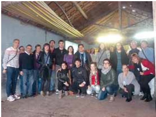
Abesbatzako kideak, Portugalera heldu berritan.

Urri bukaeran Portugalgo Alqueidao da Serran, Fatimako basilikan eta Pombal hirian kantaldiak eskaini zituen Ezoziko Ama Abesbatzak. Kantaldiotara jendetza erakarri zutela eta portugaldarrek harrera ezin hobea egin zutelara aipatu dute koruko kideek. Plaentxiako abesbatzako kide bat portugaldarra da eta bere bitartez ekarri zuten, orain urtebete, Alqueidao da Serrako abesbatza Soraluzera. Datorren urterako asmoa da Pombal hiriko abesbatza herrira ekartzea.