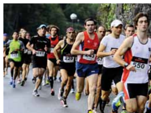
Ehundaka lagun bidegorrian antxintxiketan.