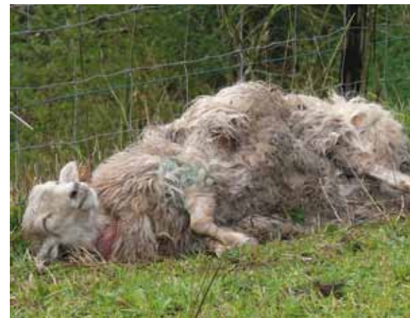
lazgo neguan gertatutako eraso baten ondoriozko irudia.

Baserrietan konpostatzeko ohitura zabaltzeko Debabarreneko Mankomunitateak martxan jarri duen kanpainaren berri eman zuten martitzenean udal-txean egindako batzarrean. Mankomunitateko teknikariak baserriko baserri ibiliko dira zela konpostatu behar den erakusten. Edukiontzien eskaera egiteko aukera ere izango dute baserritarrek.