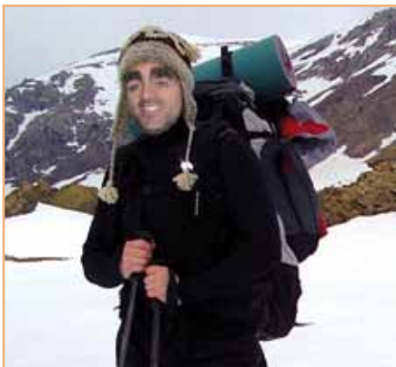
Saria: "Bazen behin... bizitza" mahai jokoa