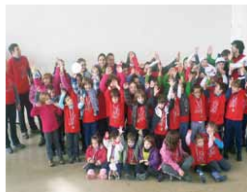
Mendi taldeko gazteak, banatutako medailak eskuan.

Mendi taldeko lagunek jai giro eder eta Mjendetsuan agurtu dute, udaberrira bitartean, mendi irteeren egutegia. Guztira hamahiru ibilaldi egin dituzte eta azken txangoan 105 bazkidek hartu zuten parte. Trenbide zaharretik Txurrukarako bidea hartu zuten eta handik San Andresera abiatu ziren. Ohikoa den babajanaren aurretik urte osoan zehar zortzi gailur egin dituzten mendizale gazteei domina bana banatu zitzairen. Martxoan ekingo diote berriz egutegia antolatzeari.