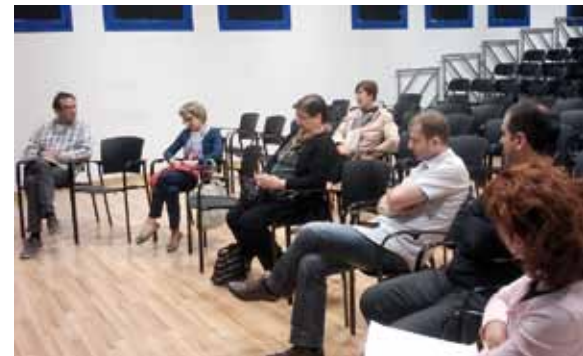
Urriaren industria arloko ordezkariekin egindako bilera.