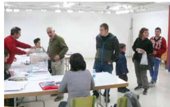
Joan zen urteko udal eta foru hauteskundeetako irudia.