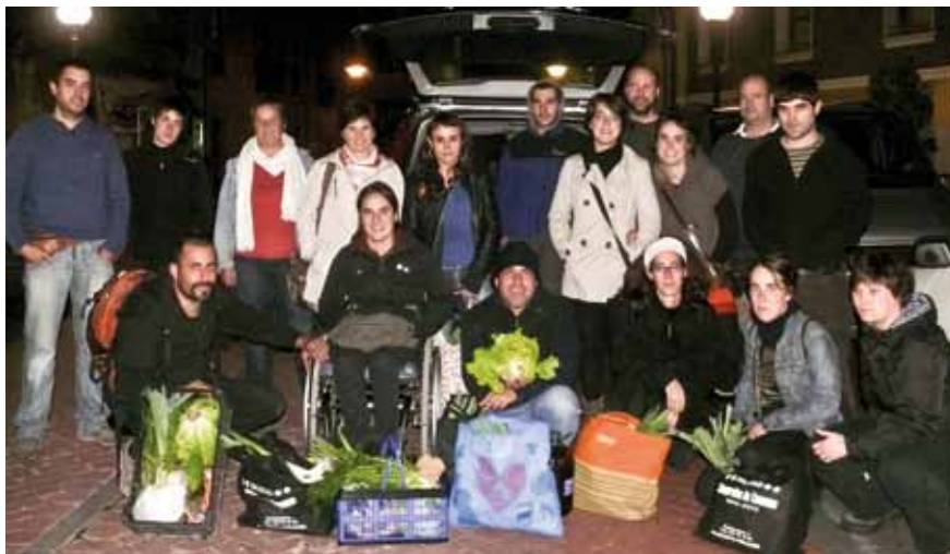
Taldekieak astelehenean egin zuten banaketaren ostean.

Elikaduraz kontzientzia hartzeko beharra Bidetxiorreko kideek hilero egiten dituzten taldeko bileretan elikadurarekin zerikusia duten gaien inguruko informazioa trukatzeko tartea hartzen dute. Hala ere, herritarren artean kon-