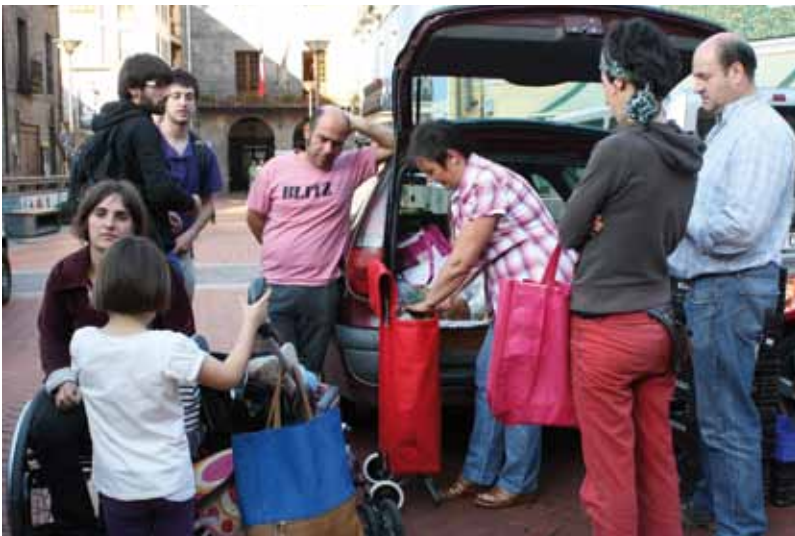
Bidetxiorrek ekainean egin zuen lehen banaketa.

Bidetxiorreko kideen helburua argia da, elikaduraren kontrola berreskuratzea. Zer jan nahi duten erabakitzea, zeinek, non, zela eta zein baldintzetan ekoiztuak diren jakinda. Hori dela eta, talde gisara modu biologikoan ekoiztutako elikagaiak bakarrik kontsumitzen dituzte. Kontsumo zuzena antolatzearekin batera "gaur eguneko ohiko kontsumo sistemarekin kritiko izan nahi dugu. Batetik merkatalgune handiek herrietako merkaturak suntsitzen dutelako eta bestetik herrietako merkaturak askok banaketa sare handien produktuak saltzen dituztelako. Etorrizuneko bidea herrian herrikoa eta ekologikoa erosi ahal izatea da".