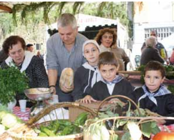
Baserritarrak izango dira protagonista Gaztañerre Azokan.