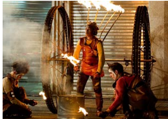
Suzko errobera erraldoiekin egingo dute antzezlanaren.

Erbestertzia herrialde dantetan emoten dala bisualki adie-