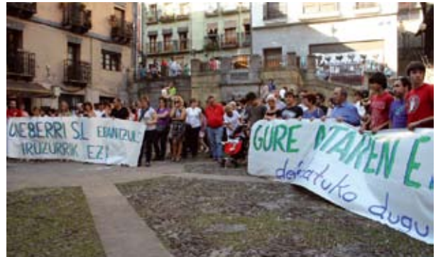
Kaltetuek, senideek eta lagunek osatu zuten elkarretaratzea.

tzak Donostiako Arkitektoen Kutzaren eskuetan daude eta udala harremanetan da eurekin. Ezer zehaztu gabe, “iruzurra” salatzekeo ekimen gehiago egingo dituztela aurreratu dute kaltetuek.