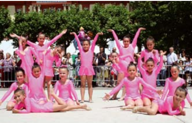
Herriko gimnasta txikiak Eibarren dantzan

Urte osoan ikasitakoa erakusteko asmoz Eibar eta Soralezeko hirurogei gimnastek kolorez eta dantzez bete zuten aurreko zapatuan Arane kiroldegia. Koreografia ikusgarriak eta mugimendu zailak gailendu ziren erakustaldian eta ikusleen txalo zaparradek berotu zuten saioa. Domekan berriz herriko gimnastek Eibarko San Juan erakustaldian hartu zuten parte.