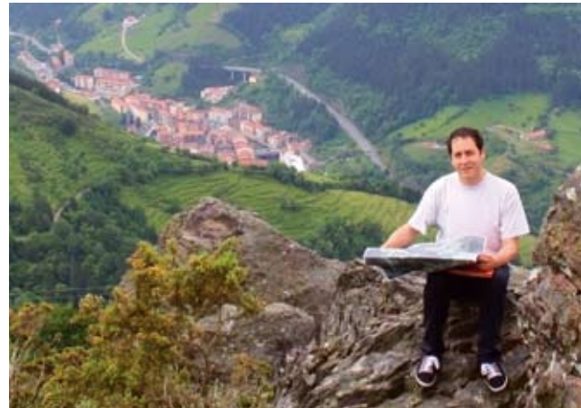
Munetako edo Arantzazuko haizetan jasotako irudia

ten jakona egiten: basarritarreri lur zatixen izenegaittik eta kokapenagaittik galdetzen.