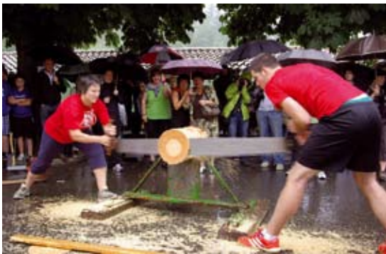
Arrixatarrak trontza lanetan.

Jende mordoxka urreratu zen hilaren 10ean Ezozki eta San Andres auzoen arteko herri kirol desafioa ikustera. Azkenean Ezoziko taldea gailendu zitzaion San Andresko taldeari lau eta biko emaitzaz irabazita. Kaskara batzen eta ingudean San Andreskoak izan ziren nagusi; zaku karreran, txingetan, trontzan eta sokatiran berriz, Ezozikoak. Buel-tako saioa San Andresko jaietan jokatu dute, uztailaren 7an.