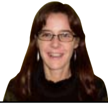
Ubane Madera Bagatozela!

B anentorren Mugarritik behera, derrepente ai! Shhhhhhh! Entzun nuenean. Begiratu, eta bi begi pare aurkitu nituen, belar artean. "Aupa!" Esan nuen. "Aupa" erantzun zidaten, ahots beheran. "Ondo zaudete? Bai", eta zutitu egin ziren. Bi emakume ziren. Galdetu nien: "Zer egiten duzue? Ba, ezkutuan, badaezpada. Badaezpada? Zer ba? Aspaldiko kontua da; derrigortuta gaude ezkutuan bizitzera, ia desagerrarazi egin gintuzten-eta. 1300. urtean hasi zen. Boteretsu ginen orduan: herritarren eztabaida eta haserreak konpontzen ahalegintzen ginen, beldurrak uxatzen eta gaixotasunak sendatzen. Erabaki nagusiak hartzen genituen, berdintasun eta justizian oinarrituta. Baina hori ez zen gustukoa boteretsu izan nahi zutenendako. Beste botere mota bat nahi zuten: interes partikularretan oinarritutakoa. Urteekin interes hori diru bilakatu zen, zuek hala ezagutzen duzue. Eta gure kontrako segizioa hasi zuten. Gutariko asko erre egin zituzten. Azkenean ezkutatzea erabaki genuen. Orain, bakarrik azaltzen gara ondo hartzen gaituzten lekuetan. Badira 500 urte Plazentziara etortzen garela, orain arte San Juan sua esaten zeniotek ekitaldira, uste dugu orain Udate gaua ipini diozuela. Herrian kamuflatuta dauden bestelako sorginekin elkartu eta primerako gaua pasatuko dugu. Guztiok gonbidatuta zaudete!"