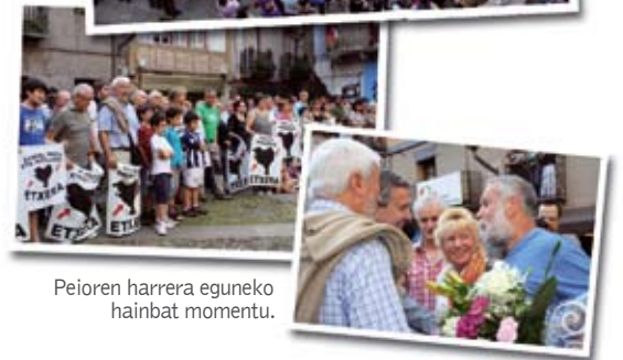
Peioren harrera eguneko hainbat momentu.