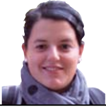
Aiora Elizburu Aitxitxa eta Amama

Zutabe honetan azkenengoz Zidatzi nuenean, nire amari eta orokorrean ama guztiei omenalditxo bat egin nahi izan nien. Denbora nahikotxo pasada ordutik eta jada ni ere amatxo bihurtu naiz. Tik-tak tik-tak zelako azkar doan denbora! Eta orain ama naizela, goizero kalean nabilela, egunero ikusten ditut aiton-amonak bilobak zaintzen, eurekin paseotxo ematen... Gurasoak lanean daudelako edo eresketa batzuk egiten gaudelako edo etxea jasotzeko denbora behar dugulako beti laguntzeko prest agertzen direnak. Umeak ikastolara eramanez, gaixo daudenean sendagilearengana lagunduz... Edozein egunetan, edozein ordutan hor daude, okindegian "flauta" erosten, goxokidendan "gusanitos" edo jostailudendan baloia. Beraiek haurrak baino alaiago, Jainkoari edo batek dakinori osasuna eskatzen bilobak nola hazten diren ikusteko eta beraiekin jolasteko. Azkar eta lanpetuta bizi garen garai honetan ezinbestekoak ditugu aiton amonak, seme alabak hazten eta hezten laguntzen baitigute eta askotan, hau guztia eskertzea ahazten zaigula iruditzen zait. Horregatik nire begirunea munduko aitona amona guztiei eta nire esker ona Suarren aitxitxa eta amamei.