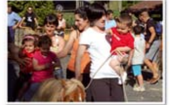
Iaz Ezoziko eguna giro onean pasa zuten inguratu zirenek.