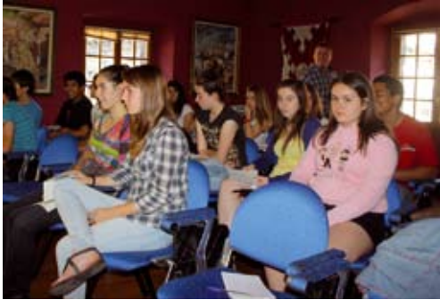
Saria irabazi duen ikasle taldea.

A genda 21 programa dela eta, institutuko ikasleek mugikor-tasun jasagarria izan dute langai aurtengo ikasturtean. Herri hobea irudikatzeko ahaleginetan, aurreko martitzenean saio aretoan udal