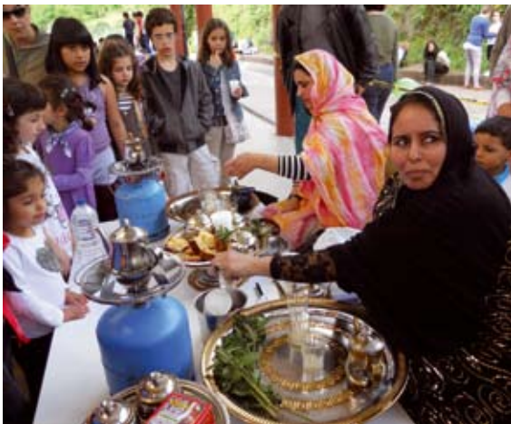
Ama saharaiak teia prestatu zuten iazko Elkarbizitza Egunean.

18:30etik 20:00ra DANTZALDIA, Pottoka taldearekin.