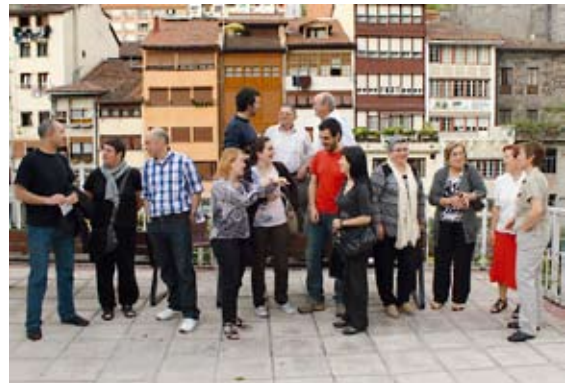
Berbalagun taldea elkar ezagutzen.

euskaraz trebatzeko eta ikasteko bide aberasgarri moduan definitu dute Berbalagun egitasmoa. Irailan zabalduko da berriz izena emateko epea.