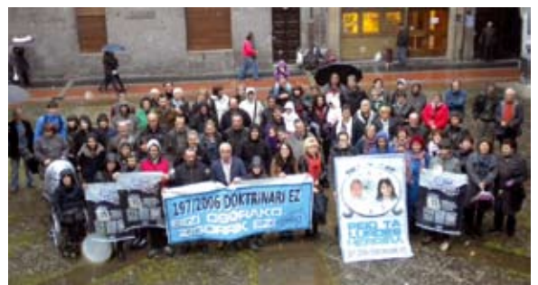
Plazara ekimena babestu duten zenbait herritar.

11:00etan MURAL MARGOKETA Plaza Barrixan 11:00etatik 13:00etara UMEGUNIA 13:00etan MUSIKA LASAIA zuzenean Jarraian TXORIZO eta SAGARDO banaketa 13:30ean EKIMEN PARTE HARTZAILEA, dantzariak lagunduta 14:30ean BAZKARI HERRIKOIA