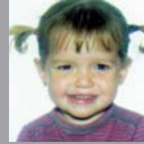
Zorionak sorgintxo! Apirilan 12xan 3 urte! Txokolatezko muxu pila pila etxeko danon partetik, bereziki Ilargin partez!