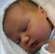
Irati Oregi Apirilan 10ian jaixua! Ongi etorri ttiki! Kolorez eta pozez betetzen gaituzuelako, patxo potolo bat etxeko danon partez!