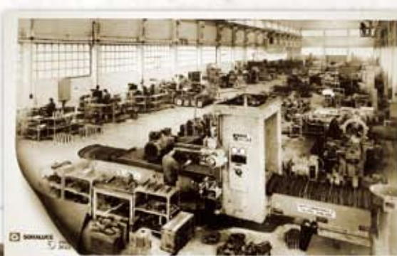
Iraganeko eta gaur egungo lantokiaren irudiak.