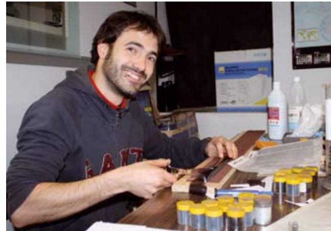
Argazkien negatiboak mozten.