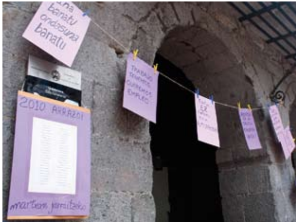
Parekidetasuna bultzatzeko herritarrek eskegitako aldarriak.

tzeaz gain, martxoaren 7tik 30era bitartean luzatuko da Udaleko Parekidetasun Batzordeak, Emakumeen Topaguneak eta Pil-pilean Euskara Elkarteak emakumeen eskubideak defendatzearen harira antolatu duten egitaraua. Ekin-tzokin eguneroko bizimoduan oso errotuak dauden emakumeen eta gizonezkoen arteko jarrera ezberdinak azaleratu nahi dituzte. Bestetik emakumeei egungo gizartearen behar duten lekua aldarrikatzeke jarrera estrategiak eskaini nahi dizkiete, bai indibidualki eta baita taldean ere. Hausnarketa bultzatzeko ekimenak izango dira, parekidetasunean oinarrituta, harreman egitura berriak eraikitzeke helburua dutenak.