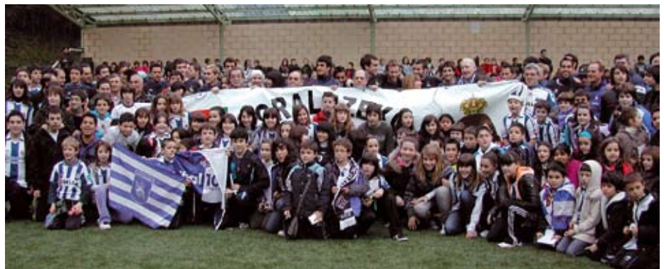
Iazko urtarrilean Errealak Ezozin entrenatu zuenean.

14:30ean: Bazkaria, Txurruka jattetxean.