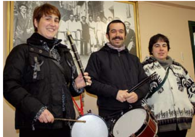
Antolakuntzan ari direnetako batzuk.

Goizeko 10etan Plaza Zaharrian batu eta txistularixen kalejiria egingo dogu Mese-deetako Amaren Egoitzaraino. Bertan, dantzarixekin batera, fandango eta arin-arina dantzatu eta herrira jaitsiko gara, kaliak girotzera. 11:30ean buruhaundixen kalejiria izango da eta 12etan salda eta txorizua jateko tartia be hartuko dogu. Indarrak batuta, dantzarixak eta dantzan egin nahi daben herritarrekin batera kalejiran urtengo dogu, txistu doinua eta dantza herrikoiak tar-tekatuz. 15etan Allegron baz-