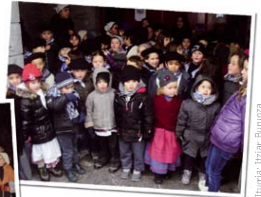
Goian: Santa eskian baserriz baserri.