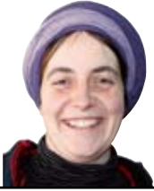
Arrate Gisasola Herria eta hezkuntza