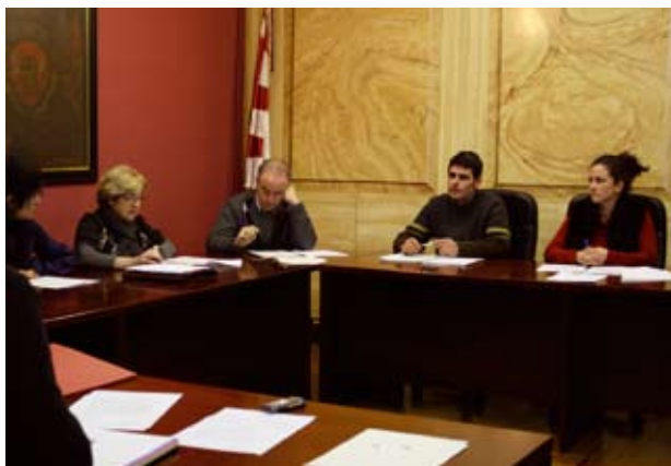
Gobernu Taldeak zaborrak kudeatzeko hainbat sistema aztertu nahi ditu.

Zaborren kudeaketari buruzko lau puntuko mozioa, EAJk eta PSE-EEk elkarrekin aurkeztutakoa ere onartu egin zuten. Bi alderdiek bosgarren edukiontzia aldeko jarrera argia agertu zuten. Jeltzaleek atez-ateko sistema "askoz ere garestiagoa" dela esan zuten. Sozialistek ere kontrako jarrera azladu duten, atez-atekoa "zikina" eta "kutsakorragoa" dela eta hainbat elikagairen kontsumoa mugatzen duela. Gobernu Taldeak erantzun zuen ezin dela esan garestiagoa izango denik azterketa bat egin gabe eta bere helburua zaborra kudeatzeko beste aukera batzuk aztertzea dela. Bilduk Kutxabanken gainean aurkeztutako mozioa onartu egin zen, sozialistek eta gobernu taldeak alde bozkatu zuten. EAJk kontra bozkatu zuen udaletik gaineko gaia dela argudiatuz.