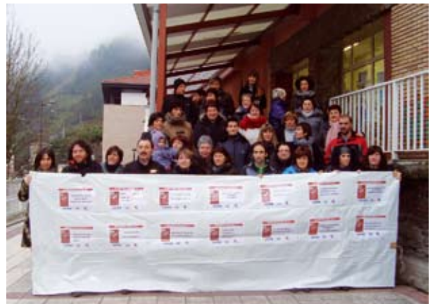
Urtarrilaren 31an irakasleek egindako lanuztea.