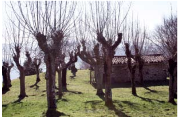
Toponimiako proiektuak lekuen izenak batu eta aztertuko ditu, "urkiiazelai" esate baterako.

denbora luzeagoak behar direla badakien arren, gai denetan oinarriak jarri nahi dituela esan du Udalak, gerora lanean jarraitu ahal izateko.