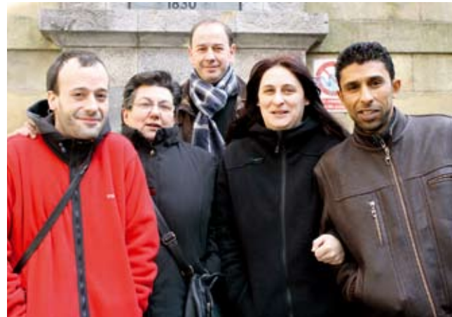
Ekimena bere gain hartu duten tabernariak.