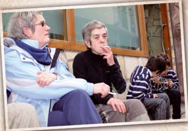
01 Urtarrila Tabakoaren legea herrian: Erretzea zigortzen hasi zen Espainiar Estatu guztian eta baita gurean ere. Oso barneratutako ohitura egun batetik bestera aldatu beharrak eztabaida sortu zuen kalean.