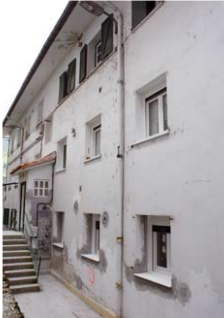
Etxebizitza sozialak eraberritze bidean.

2012ko urtarrilaren 2a bitartean, maisuen etxeetako sei udal etxebizitzetan eman ahalko da izena. Hasteko, etxebizitzak elkarbizitza-unitateentzat izango dira. Eskatzaileek Soraluzean