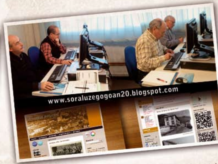
10 Urria Soraluze Gogoan bloga saritu zuten: "Euskadi 2011 Iniziatibadun helduak" saria jaso zuen KZgunetik sortutako blog honek. Lehengo sasoietako kontuen berri ematen dute bertan hainbat herritarrek, argazki eta bideoz lagunduta, eta lanean jarraitzen dute!