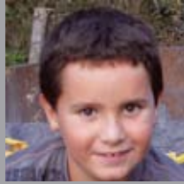
Xabat Deza Abenduan 27xan 8 urte! Zorionak eta muxu haundi-haundi bat Argateko familixian partez!