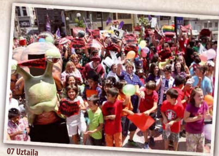
07 Uztaila Lipduba "Mugitu Gherrixa": Galtzagorriek antolatutako ekimen honetan 400 herritarrek hartu zuten parte. Santiago-Santana jaien atarian giroa berotu eta herritarren parte hartzea sustatzeko egin zen lipdub-a, eta herria bizi-bizirik dagoela frogatu zen.