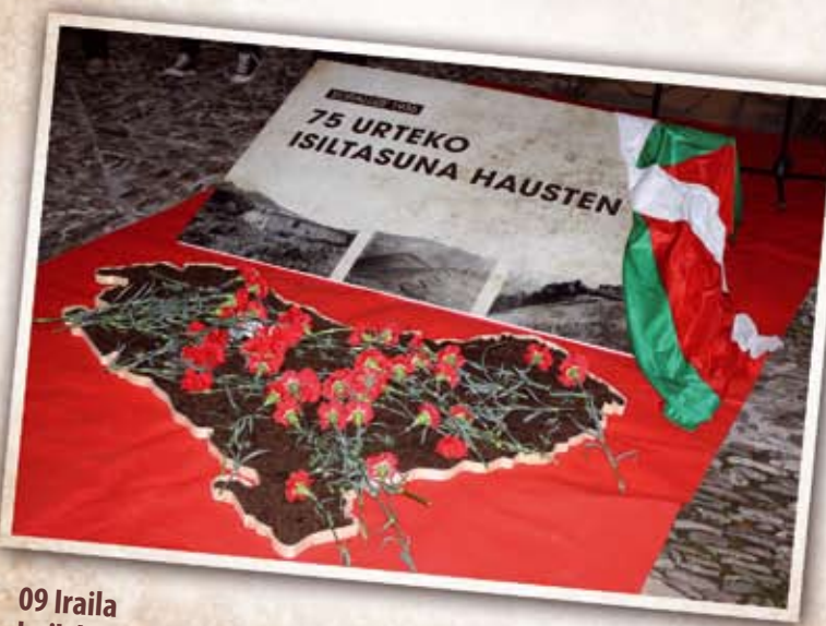
09 Iraila Irailak 22a "Oroimen Eguna": Tropa frankisten inbasio eguna izan zen, due-la 75 urte, irailaren 22a. "Soraluze 1936 Lan Taldea" k efemeridea berreskuratu eta ekitaldi hunkigarri baten bitartez 36ko gerrako biktimak omendu zituzten.