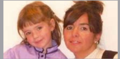
Zorionak prexioak! Etxeko guztien partez eta eguna oso ondo pasatzeko txokomarrubizko muxu pottolo bat Ametsen partez!