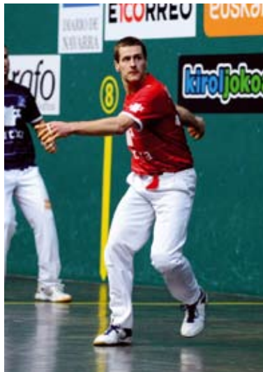
Laskurain iazko txapelketako finalean.

A benduaren 13an aurkeztu zituzten Eskuz Binakako Txapelketan lehiatuko diren bikoteak Bilboko Bizkaia aretoan. Laskurainek Xala izango du bikote txapelketa osoan zehar. Sorluzetarra pozik azaldu da eta lehiatzeko gogoz dagoela azaldu du. Xala maila oso oneko aurrelaria dela eta pilotari biek txapelketa esperantza askorekin hasi dutela ere nabarmendu du.