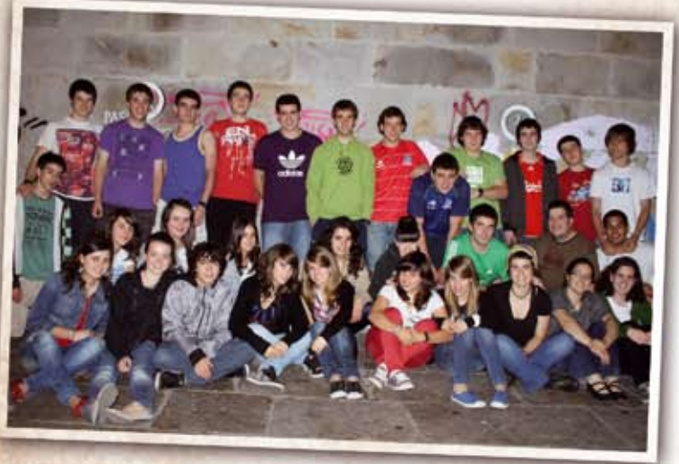
05 Maiatza Jai Batzorde berri eta sendoa: Galtzagorri Jai Batzordeak Santiago-Santana jaietako egitaraua prestatzeko egindako deialdiak erantzun zabala jaso zuen herriko gazteengandik.