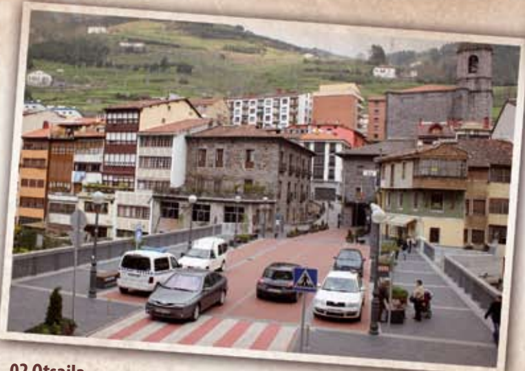
02 Otsaila Erdigunearen peatonalizatzea: 2010 urte bukaeran jakinarazi zuen Udalak erdialdea oinezkoentzako leku bihurtu nahi zuela. Otsailetik ibilgai-luei herri barruan ibiltzeko ordutegia murriztu egin zaie, 13.00etik goizeko 07.00etara bitartean.