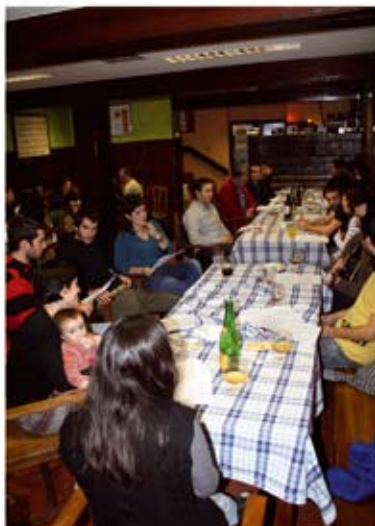
Batu sutondora jardunaldietako hiru une.