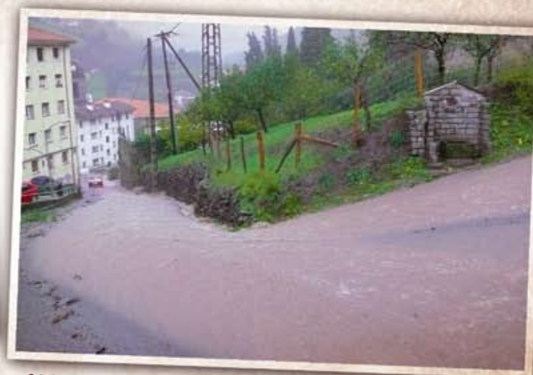
11 Azaroa Euritea herrian: Azaroaren 6a, domeka, euria egin eta egin aritu ondoren, hainbat baserri auzotan luizi haundiak izan ziren eta isolatuta geratu ziren Irure, Ezozki edo San Andresko auzoak, baita herria bera ere. Herritarrek lan handia egin behar izan zuten urak berbideratzen.