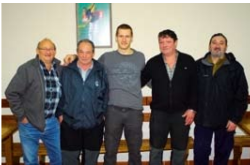
Herriko jarraitzaileen animoak jasotzen hasi da Lasku.