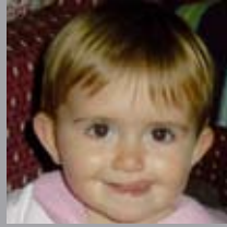
Jone Urresti Abenduan 9xan urtebete! Muxu pila aitaxo, amatxo eta etxeko danon partez!