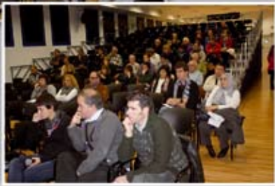
Udaleko ordezkariak eta abonatuak bileran.