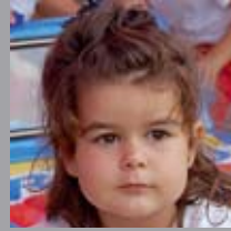
Miren Osinaga Abenduan 11n 4 urte! Zorionak poxpolin! Muxu haundi bat familixan partez!!