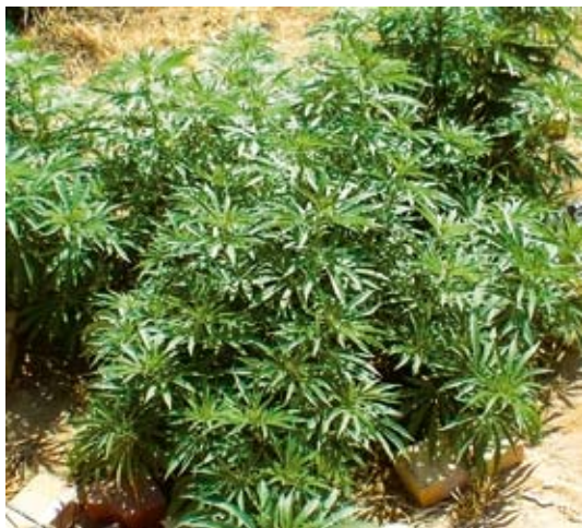
Beste landaketa baten irudia.

Bergarako ertzain-etxeko agenteek pertsona bi atxilotu zituzten Soraluzean, (32 eta 26 urteko bi gizonetako) ustez marihuana edukitzea eta haztea eta horrekin trafikatzeko egotzita. Bergarako ertzain-etxeak jakinarazi duenez, Ertzainek sail batean landatutako hogei-