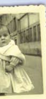
San Blas opilak bedeinkatzera sei bat urte urterekin (beheko ilaran, erdian)

"Psikologia ikasketek ulerkorragoa izaten lagundu didate"