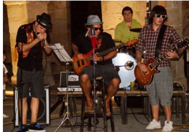
Laukotea inprobisazio kontzertutxo bat ematen.

Mendata tabernako jabiak, Gregoritik, proposatutako izena da. Bluesantzat berezika dala eta atentzina deitzen zebala ikusi, izena gustatu eta berau erabiltzia erabaki genduan. Gaztelaniazko "que pasa tronco" esaeria euskaratetik dator!